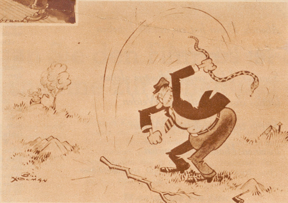
Der kurzsichtige Schlangentöter

* Verteidiger: «Meine Herren, sehen Sie sich den einen Angeklagten an, und sehen Sie sich den anderen an, — können Sie dann den milderen Umstand bestreiten, daß beide in schlechte Gesellschaft gekommen sind?»