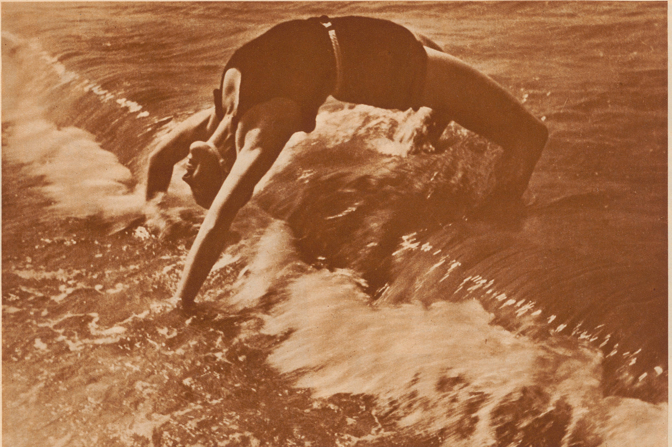
DIE BRÜCKE IN DER BRANDUNG