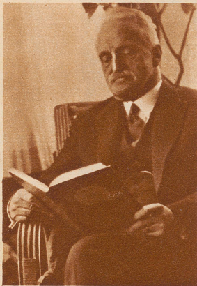
Links: Prof. Dr. Otto von Greyerz, Dozent an der Berner Universität und bekannter Schweizer Mundart-Schriftsteller, feiert in diesen Tagen seinen 70. Geburtstag