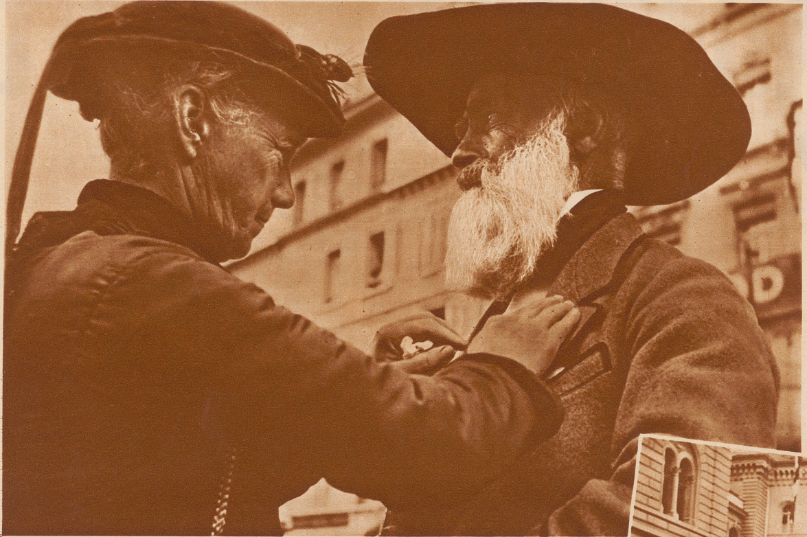
Aus allen Zipfeln des Bernerlandes kamen Schützen und Nichtschützen zur Jahrhundertfeier des Kantonalverbandes in der Bundeshauptstadt zusammen. Viele Festteilnehmer stellten sich in ihren Trachten ein. Bild: Das Guggisbergmüeti ordnet dem alternden Simishansjoggeli den Festtagskragen