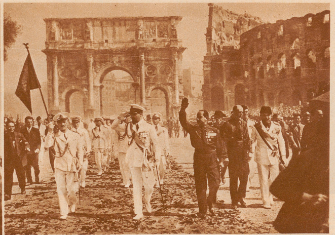
Der Triumphzug der Atlantikflieger durch den Konstantinbogen