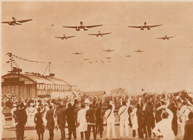
Das Balbo-Geschwader über Rom unmittelbar vor der Landung im Hafen von Ostia