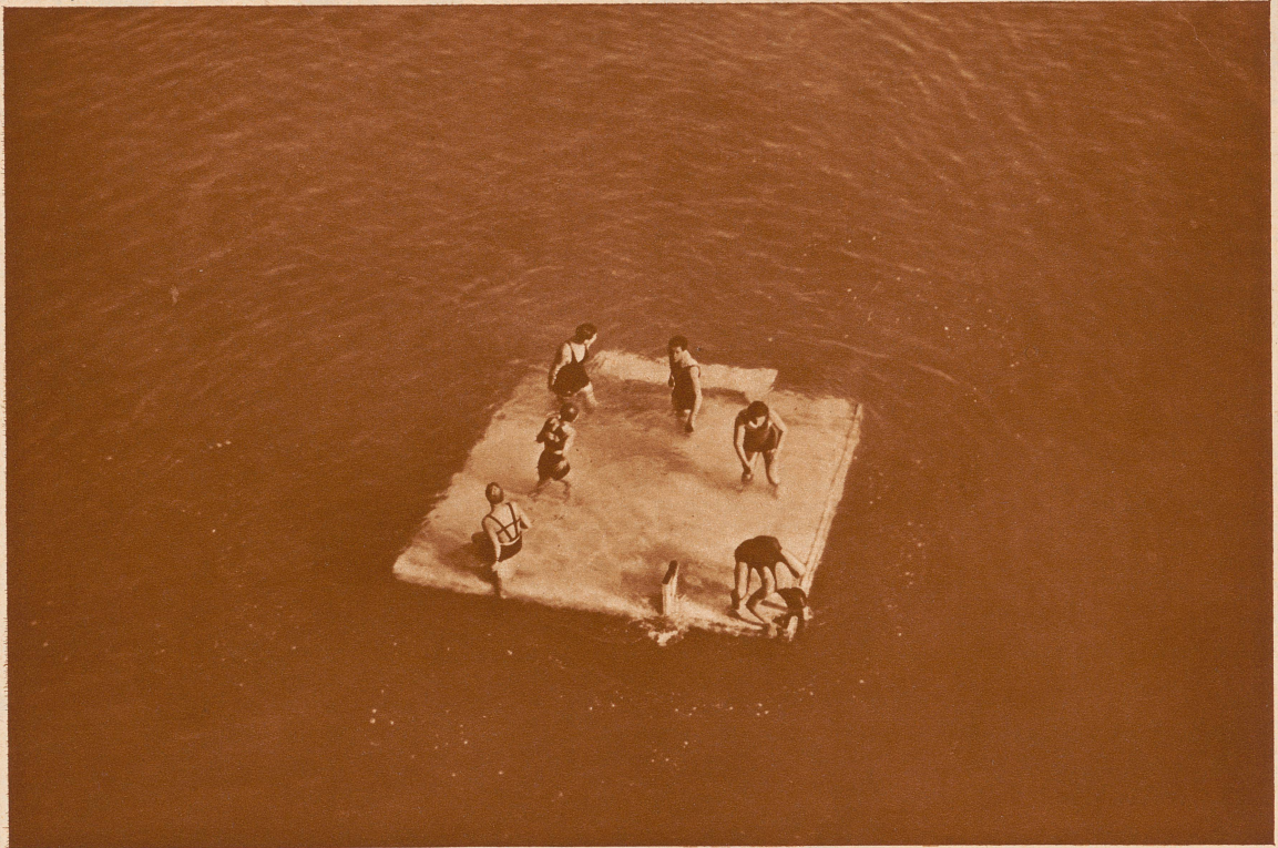
SECHS MENSCHEN TREIBEN AUF DEM GENFERSEE