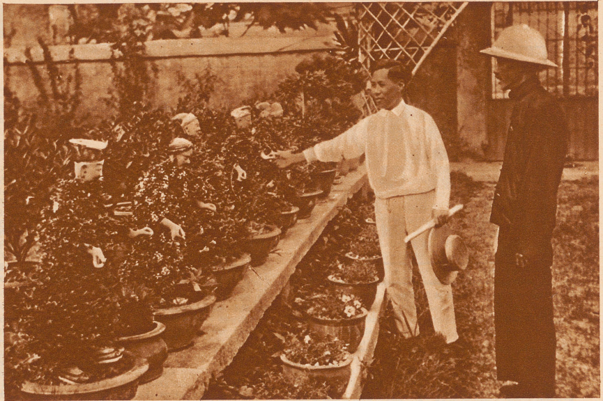
Aus der Heimat des chinesischen Nationalhelden.

Der Meister kam vor Mittag, sich zu verabschieden. Ich hatte Neigung, ihm dem Namen Mörder zuzurufen, ihn anzuschreien, daß das Leben einer kleinen Katze mir viel wichtiger war als die schönsten Verse. Aber wir waren alle mitschuldig. Uebrigens wäre auch jedes Wort ver-