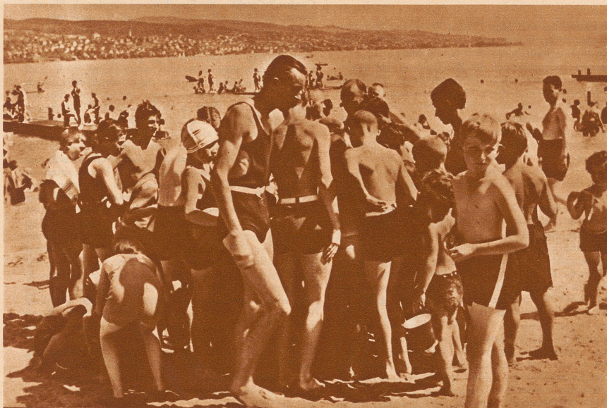
Ei, was gibt es wohl hier wichtiges zu sehen?