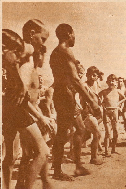
Des Rätsels Lösung

sonst in unserem kühlen Norden die herrliche Wärme seiner Heimat.