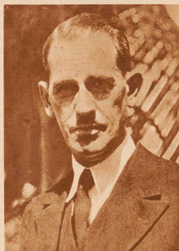
Diktator San Martin. Durch Dekret des Präsidenten San Martin ist die Verfassung von Kuba außer Kraft gesetzt und die Diktatur errichtet worden. Der Ausnahmezustand soll bis zu den Neuwahlen andauern

Aufnahme aus den Telefunkt-Werkstätten, Albisrieden