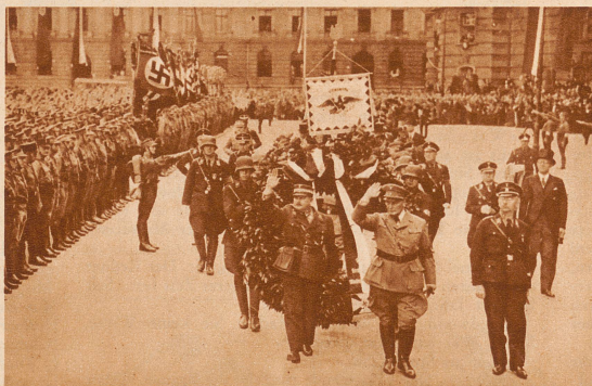
Die Eröffnung des preußischen Staatsrates. Am 15. September fand in der Berliner Universität die Eröffnungssitzung des von Ministerpräsident Goering geschaffenen preußischen Staatsrates statt. Dieser Staatsrat, eine rein preußische Angelegenheit, setzt sich zusammen aus 68 Vertretern der Kirche, der Wirtschaft, der Kunst, der Wissenschaft und der Arbeit. Er ist das «höchste und vornehmste Gremium des preußischen Staates». Bild: Stabschef Röhm, Ministerpräsident Goering und S.S.-Führer Himmler begeben sich an der Spitze des Staatsrates zur Kranzniederlegung zum Denkmal Friedrichs des Großen