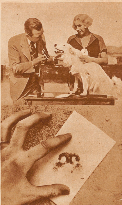
Nasenabdruck als Erkennungszeichen

Eine schlanke Figur mit gesenktem Kopf war hereingeglitten. Sobald sie sah, daß niemand sonst da war, ging eine Veränderung mit ihr vor, und ich merkte sofort, daß ich hier nicht das gewöhnliche, furchtsame, stumme Mädchen Indiens vor mir hatte. Mit einer schlanken