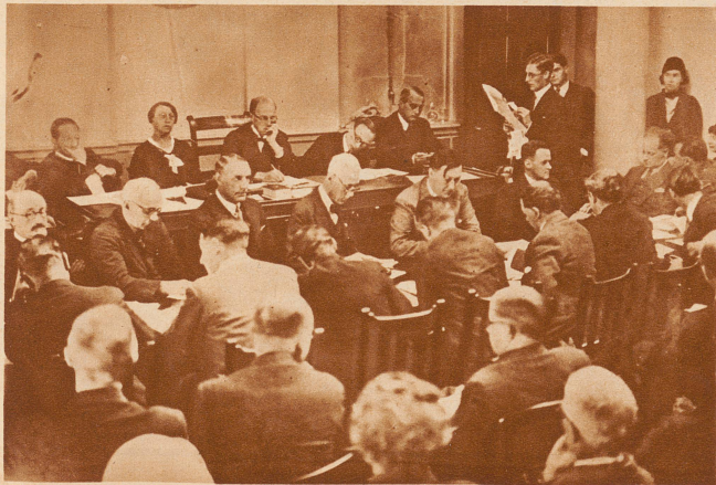
Der Scheinprozeß in London. In London tagt jetzt der seit langem angekündigte «Gegen-» oder «Schein-Prozeß» um den Reichstagsbrand. Berühmte Rechtsanwälte aus verschiedenen Ländern sind bei dem Prozeß beteiligt. Die deutsche Regierung hat in der Sache bei der englischen Regierung ohne Erfolg Protest erhoben. Unser Bild zeigt eine Sitzung der beteiligten Anwälte im Saal der Law-Association