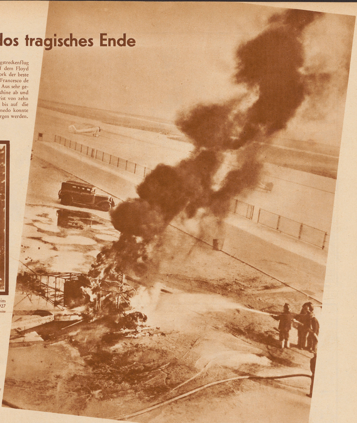
Die Flugplatzfeuerwehr bei der Löscharbeit