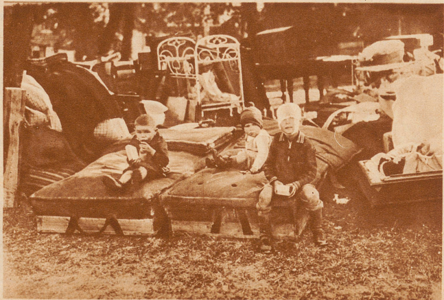
Die Brandkatastrophe von Oeschelbronn. 203 Gebäude, darunter 83 Wohnhäuser, des Ortes Oeschelbronn sind der Feuersbrunst zum Opfer gefallen. 400 von den 1500 Einwohnern sind obdachlos. Menschenleben sind keine zu beklagen. Bild: Gerettete Habe