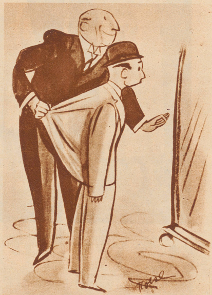
«Paßt wie angegossen, Herr Würmli!»

Gleich und gleich. Der Arzt ließ sein Auto beim Automechaniker Neppermann in Ordnung bringen. Neppermann nahm ihm dafür zwanzig Franken ab und murmelte dazu: «Gut gereinigt und geölt! — Sie werden fabelhaft rennen, Herr Doktor!»