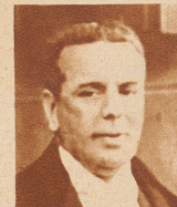
Minister Luis Quesada der neue Gesandte von Peru bei der Eidgenossenschaft. Aufnahme Rohr