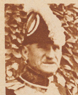
Minister Miroslaw Spalaikowitsch der neue Vertreter Jugoslawiens in Bern.