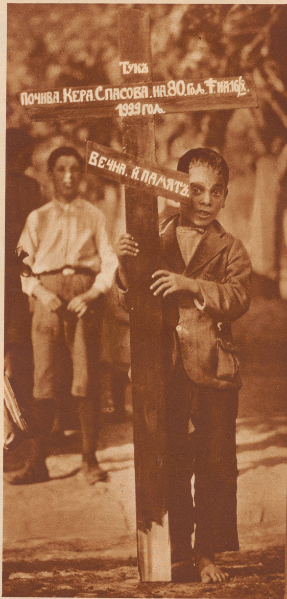
An der Spitze des Trauerzuges marschiert ein Dorfjunge mit einem großen Holzkreuz. Darauf sind in bulgarischer Inschrift Namen und Todestag der Verstorbenen eingezeichnet

In einem bulgarischen Dorf stirbt eine Bäuerin. 74 Jahre ist sie alt geworden. Auch sie wird mit zwei weißen Pferden auf dem landesüblichen Totenwagen zur letzten Ruhstätte gefahren. Die Eigenart bei dieser Beerdigungsfeier: die Musikanten. Ohne lustige Musik gibt es auf dem Balkan keine Tauf-, keine Hochzeits-, aber auch keine Totenfeier.