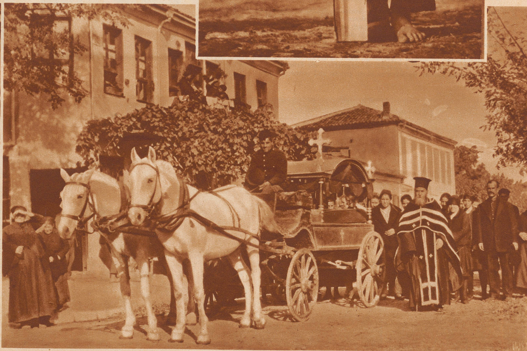
Der Trauerzug vor dem Hause der Verstorbenen. Der Pope hat eben sein Gebet beendet, die Angehörigen zeigen keine sonderlich betrübten Mienen, der Zug setzt sich zur letzten Fahrt der Verstorbenen, - zum Friedhof, - in Bewegung.