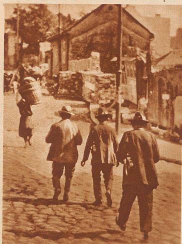
Balkan-Begräbnisfeier. Drei Musikanten begeben sich ins Trauerhaus. Bis in die späte Nacht hinein wird nach der Beerdigung im Hause der Verstorbenen musiziert, gesungen, getrunken.

In einem bulgarischen Dorf stirbt eine Bäuerin. 74 Jahre ist sie alt geworden. Auch sie wird mit zwei weißen Pferden auf dem landesüblichen Totenwagen zur letzten Ruhstätte gefahren. Die Eigenart bei dieser Beerdigungsfeier: die Musikanten. Ohne lustige Musik gibt es auf dem Balkan keine Tauf-, keine Hochzeits-, aber auch keine Totenfeier.