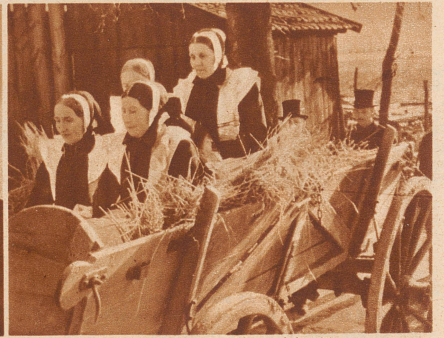
Die weiblichen Verwandten fahren auf dem Totenwagen mit. Die Witwe des Verstorbenen sitzt auf dem Sarg.