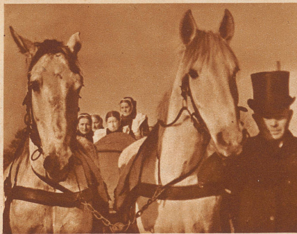
Der nächste männliche Verwandte des Verstorbenen führt die Pferde.