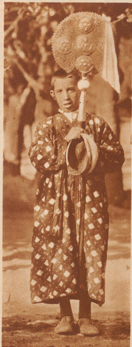
Ein Jüngling aus der Verwandtschaft, in rotem, kimonoartigem Mantel, trägt im Trauerzug ein goldenes Symbol mit.