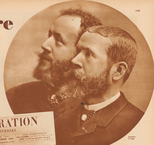
Paul und Gustave Voisin.

ihres französischen Aufenthaltes aufgestellt haben, zählen in die Dutzende. — Im selben Jahr 1908 erlebten die Brüder Farman ihre unabhängigen Triumphe, zum Teil auf Flugzeugen der Brüder Voisin. — Seit 1908 begehen wir in der Fliegengeschichte Brüderpaare nur noch in seltenen Ausnahmefällen. Der Grund liegt auf der Hand: seit das Fliegen aus der Kinderstube heraus in das Leben trat und sogar zu einer Großindustrie wurde, haben sich die Vorbereitungen für die Arbeitweise der Konstrukteure von Grund auf geändert. Die Zeit der baskischen Brüderpaare, die sich bühnenversteckten Fahradschickanten in vorböi. Die moderne Arbeitsteilung ist in das Fliegen eingegriffen und diese schließt schon zum vornehmsten jede Form der patristischen Zusammenarbeit von Brüdern aus, die füreinander alles zu tun, alles zu öffnen. Freundschaft unter den schwierigsten Verhältnissen der Erfindungsarbeit zuzunehmen bereit sind.