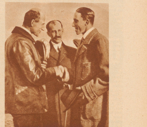
Orville und Wilbur Wright waren die ersten Menschen überhaupt, die auf einem Flieger konstruierten und gezielte Flüge ausführten. Das geschah im Dezember 1903, also vor 30 Jahren. — Unser Bild zeigt die beiden Brüder zunächst eines Besuchs in Hampton, im Gespräch mit dem König von Spanien. Von links nach rechts: Wilbur Wright, Orville Wright, Alfonso XIII.

1883 Die Gebrüder mit dem Motor des elektrisch angetriebenen, lekbaren Ballons der Brüder Tissandier bei einem Fluge über Paris im Jahre 1883. Zeitgenössische Publikation in der Pariser «Illustration».