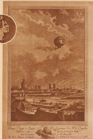
Der erste Ballonaufstieg mit menschlicher Besatzung. Nachdem verschiedene Aufträge mit dem von den Brüdern Montgolfier erfundenen und konstruierten Luftballon, mit Tieren als Besatzung, gelungen waren, versuchten sich am 19. Oktober 1783 zum erstenmal in der Geschichte zwei Menschen dem Ballon an. Es waren die beiden köstlichen Edelleute Pilatre de Rozier und der Marquis d'Arlandes. Mit der 2870 m großen, niedrig betriebenen und dekorierten Aeronautique stiegen sie in einem von 300 000 Zuschauern auf dem Marsfeld und landeten nach gelungener 1½ stündiger Fahrt 12 km außerhalb Paris. — Im Kasten oben: Die Brüder Etienne und Joseph Montgolfier, die Erfinder des Luftballons, festgehalten auf der Plakette, die ihnen zu Ehren gegossen und verteilt wurde.