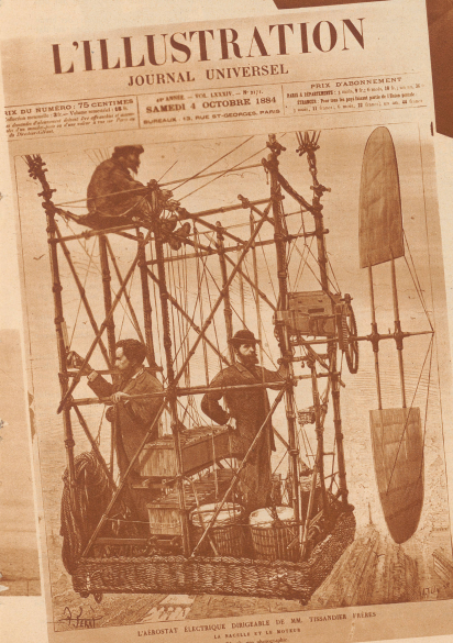
LEBROUAT ELECTRIQUE DEGRANDLE DE M. TISSANDIER FRERES

Die Brüder Tissandier, die vor 50 Jahren den ersten elektrisch betriebenen, lekbaren Luftballon konstruierten und erfolgreich fliegen ließen. Einmalig angestrichener Luftschiff haben sich nicht bewegt, sondern sind in die Höhe gestiegen, die die Art der lekbaren Luftschiffe in Frankreich begründeten.