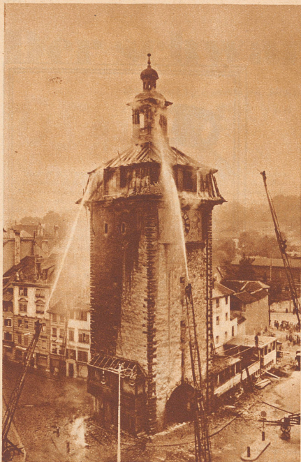
Am 22. September 1932 wurde der Barock-Dachstock dieses historischen Bauwerkes aus dem 14. Jahrhundert ein Raub der Flammen.