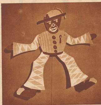
Der böse Neger Sumuru