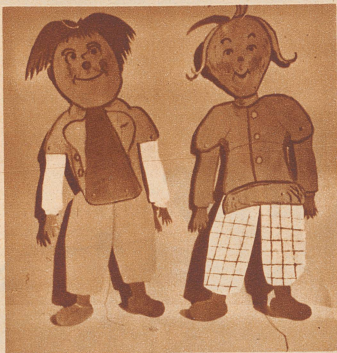
Seht nur, wie er zappeln kann.

Liebe Kinder! Ihr habt mir beim Preisanschreiben bewiesen, daß viele von euch sehr nett zeichnen können. Darum zeige ich euch jetzt etwas ganz Lustiges, das ihr auch selber herstellen könnt: Einen Hampelmann. Manche von euch sind schon zu groß, um selbst noch mit einem Hampelmann zu spielen, aber vielleicht haben diese ein jüngeres Brüderchen oder Schwesterchen, dem so ein selbstgemachter Hampelmann viele Freude bereiten kann. Zum Geburtstag oder auf Weihnachten (es geht gar nicht mehr lange bis dahin!) gibt das ein feines Geschenklein, das noch dazu den Vorteil hat, daß es gar nichts kostet. Ihr könnt so einen Hampelmann nämlich einfach aus Karton, am besten aus einer alten Schuhbox, ausschneiden. Manch einer von euch Buben besitzt aber vielleicht sogar einen Laubsägekasten, dann kann er den Hampelmann aus einem von Vaters Zigarrenkistchen ausschneiden, das ist natürlich noch schöner und viel solider.