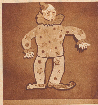
Der dumme August

den Punkten B macht ihr kleine Löcher und verbindet die Oberarme durch lockere Schnürchen miteinander und nachher in gleicher Weise die Oberschenkel. Nun befestigt ihr noch die eigentliche Ziehschnur, indem ihr sie an diesen Arm- und Beinverbindungen verknotet. Zum Schlusse bemalt ihr alles recht schön, und sicherlich werden eure kleinen Geschwister eine riesige Freude haben, wenn ihr sie mit einem solchen drolligen Burschen überrascht. — Damit ihr einige Anregungen für lustige Gestalten bekommt, zeige ich euch ein paar Hampelmänner, welche Drittklass-Primarschüler einer Basler Schule in ihrer Handarbeitsstunde mit großer Begeisterung und Freude erstellt haben. Gewiß könnt auch ihr solch flotte Kerle machen! Oder geraten sie euch am Ende noch besser?