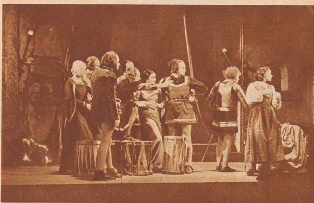
BASEL: Szenenbild aus «Die jungen Ritter vor Sempach». Dieses einaktige Schauspiel von Henry von Heiseler wurde gleichzeitig mit den «Eidgenossen» von Hans Mühlestein zur Aufführung gebracht. Es ist eines der wenigen Werke, welche die großen Ereignisse der Schweizergeschichte erfassen und dramatisch ausbeuten. Aufnahme Bürki