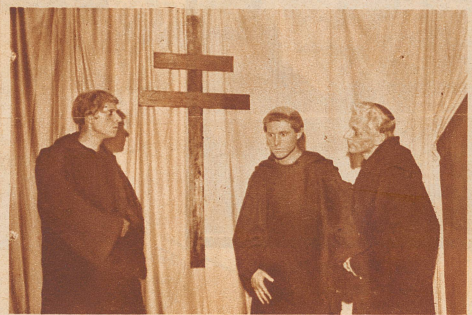
WINTERTHUR: Die Winterthurer Liebhaberbühne brachte im Kasino-Saal den Einakter «Notker der Stammler» von Hans Hagenbuch zur Aufführung, ein Stück aus der St. Galler Klosterzeit.

«Fahnen über Doxat» von J. R. Welti. Ein Drama, das für die Idee eines inneren Schweigertums wirbt, dessen Held – der Schweizer Feldmarschall Doxat – «lieber unschuldig sterben als ohne Ehren leben» will.