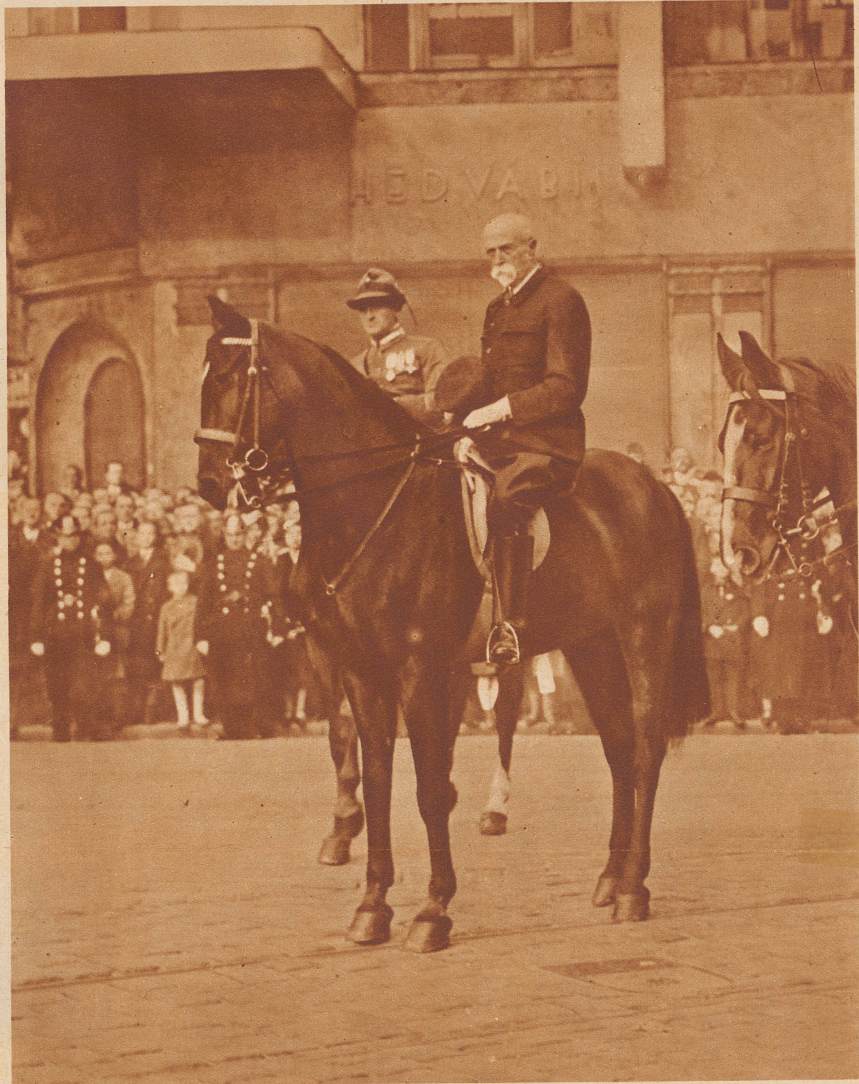
Präsident Masaryk bei der Feier des 15. Gründungstages des tschechoslowakischen Staates am 28. Oktober in Prag. Der große Gelehrte und Politiker, der heute im 83. Altersjahr steht, wurde auf Lebzeiten zum Staatspräsidenten gewählt.