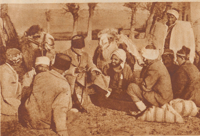
Kemal Pascha erklärt zu Beginn seiner Laufbahn seinen Landsleuten Ziel und Zweck seiner nationalen Ideen.

Die türkische Republik beging am 29. Oktober die Feier ihres zehnjährigen Bestandes. Sie ist das Werk Mustafa Kemal Paschas. Dieser kluge Kopf und zähe Verfechter seiner Pläne schulte während des Weltkrieges zunächst als Generalstabsoffizier, hernach als kommandierender General seine organisatorischen Fähigkeiten an europäischen Mustern. Die mancherlei an europäische Verhältnisse sich anlehenden neuen Ideen, die er in der Türkei zu verwirklichen trachtete, bedeuteten einen radikalen Bruch mit den dort bestehenden Sitten und Anschauungen. Mit der ganzen Kraft seiner Beredsamkeit und Beeinflussungsgabe setzte sich Kemal Pascha für seine reformatorischen Absichten ein. So gelang ihm schließlich vor zehn Jahren die Umgestaltung seiner Heimat in eine Republik, zu deren Präsidenten er gewählt wurde.