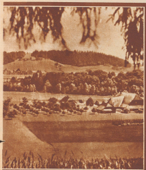
wald und Trachselwald liegen die stattlichen Bauernhöfe Oberli's. Die Gebäude des Emmenbühlens. Vor 600 Jahren, als die erste Oberli, ein Lehnmann auf dem Hofe. Von der Hildfingen, rechts: Mittelfürten.