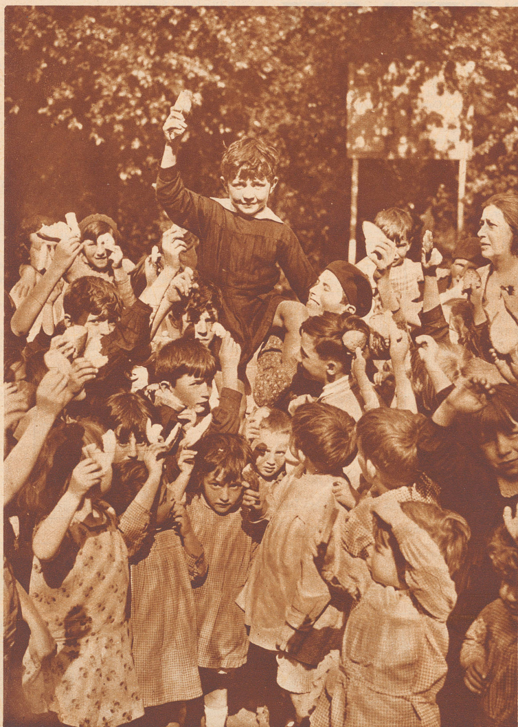
Da seht ihr alle die Kinder, die auf ihre Znüni-Schokolade verzichtet haben, um armen Kameraden zu helfen. Den kleinen Jungen, der die prächtige Idee gehabt hat, haben sie auf ihre Schultern gehoben.