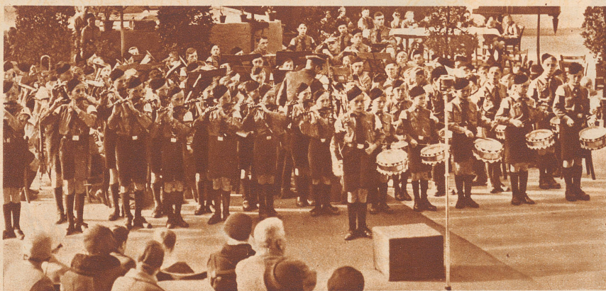
Die Buben von Klingenthal haben in der Hauptstadt ein großes Konzert gegeben, und die Einnahmen davon haben sie den Arbeitslosen in ihrer Stadt gespendet.