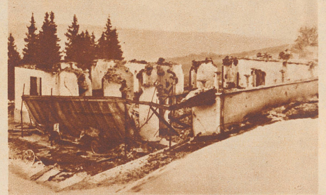
Kurhaus Schimberg-Bad abgebrannt. In der Nacht vom 16. zum 17. November ist das bekannte Schimberg-Schwefelbad im Entlebuch abgebrannt. Das Hotel, das 120 Betten faßte, sollte in diesem Winter erstmals für den Wintersport geöffnet werden. Das Gebäude ist bis auf den Grund zerstört, das Inventar blieb zum größten Teil in den Flammen. Die Brandursache ist bis jetzt nicht ermittelt.