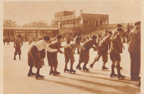
Kunsteisbahn im Winter – Wellenbad im Sommer. Am Sonntag ist in Bern die neue Kunsteisbahn und Wellenbad-Anlage (Ka-We-De) dem Betriebe übergeben worden.