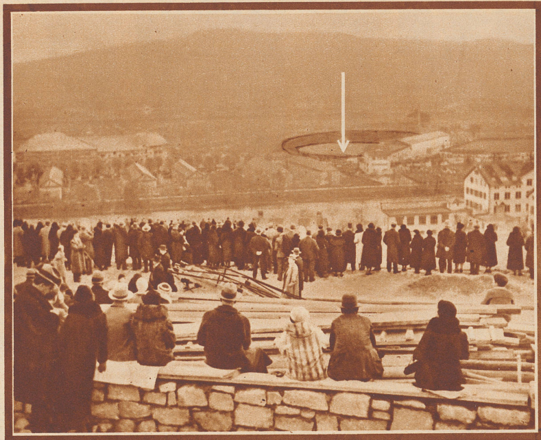
25 000 Menschen im Stadion. Tausende draußen auf den Höhen, auf unvollendeten Neubauten, auf Bäumen und Dächern. Bild: Blick vom Waidberg hinunter aufs Kampffeld.