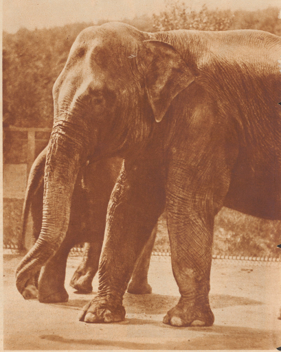
Ein oft der größten Teil eines Bildes zufallen und vergrößerte den Rest oder die sprechende Einzelheit zu verblüffenden Ergebnissen. Oft auch zu solchen, die in keiner Weise mehr Vorlagen für den Zeitungsdruck, aber immer noch schöne Photos waren. Die trockensten Dinge bekamen unter seinen Händen Leben. Er hat Sportaufnahmen gemacht, die zu den schönsten Sportbildern gehören, die es gibt: keine Rekord-Schnappshots, aber Bewegun-