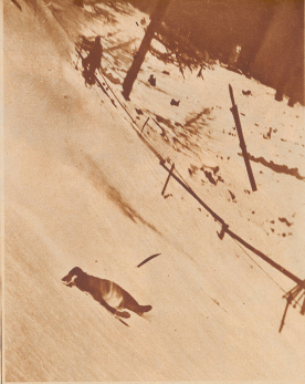
Mettler verbindet die Fähigkeiten des formensicheren Künstlers mit jenen des Reporters. Dem rechten Augenblick zu erkennen und Mitbewerber zu handeln, gehört zu den Erfordernissen eines guten Presse-Photographen. Wie ausgerollt gibt ihm Mettler-Bild von einer Sprungbahn, die ganz Gelände und Kletterer hat wieder, die zu dem Sprung und den Skipflügen gehört. Der gesteuerte Mann, die abgewinkelte Haltung auf der Bahn und der wegschwebende Ski hoch in der Luft, so ein Bild in eine Mitbewerber, tiefere eindrückliche Beschreibung.