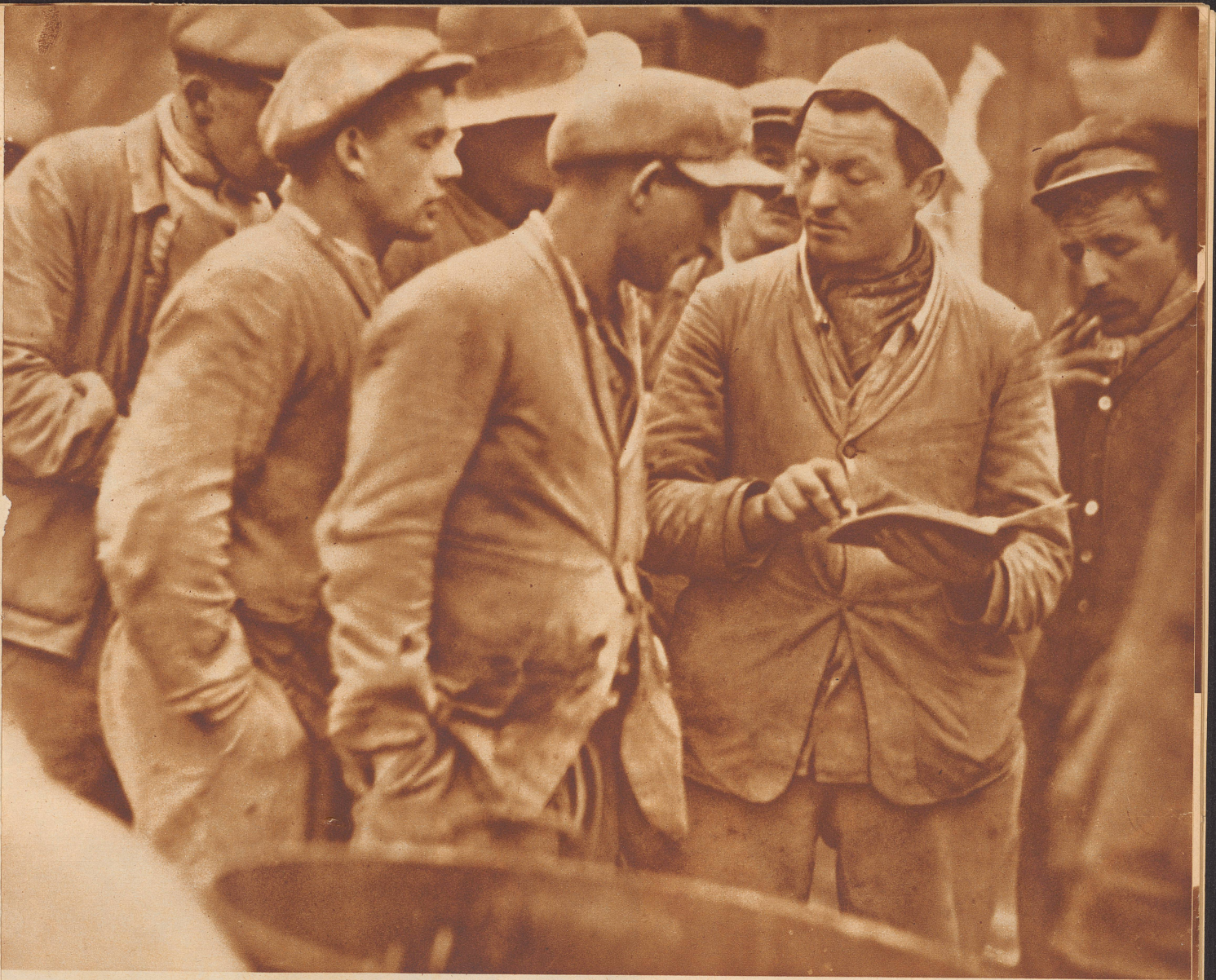
Bauarbeiter beim Rapport oder Appell. Der Beschauer merkt den Zementstaub in der Luft. Man riecht ihn fast. Die Aufnahme ist bewußt so gemacht, daß kein Beteiligter etwas ahnt. Diese Arbeiter sind ganz sich selbst überlassen, jeder auf seine Art vom andern verschieden und doch alle von etwas Gemeinsamen umschlungen. Die Wiederholung ähnlicher Formen gibt dem Bild ein ganz bestimmtes rhythmisches Leben. Die leise Unschärfe der Zeichnung ist wesentlich und weit entfernt davon ein Nachteil oder tadelnswert zu sein.