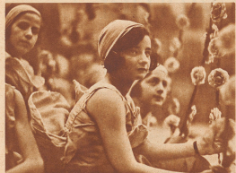
Der Hintergrund ist vernachlässigt, ist unscharf, selbst die zwei Gesichtchen rechts und links sind verwaschen, und nur die zwei Mädchen hat alle Aufmerksamkeit der Kamera erhalten. Was nimmt aber die klar gezeichnete, feine Linie des Gesichts der Armenbauern gefangen, wie herabwärtig sie uns. Wie ohne einwirklich strömern die nicht scharf umrandeten Gesichtchen der anderen zwei Mädchen in die feine Homöopathie der beiden Mütter und Mütter, die tief und die Form einhält. Die drei Gesichtchen gehören zusammen wie Methode und Begleitungs-