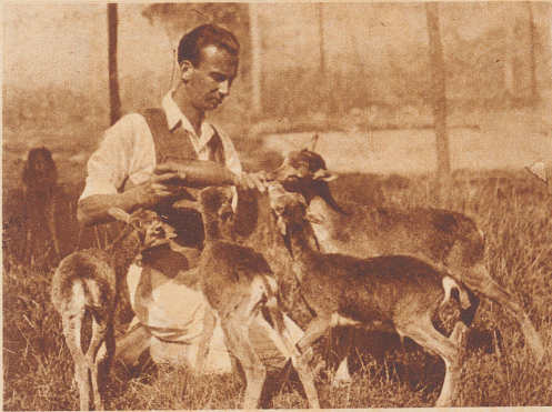
Junge korsikanische Mufflons im Zoologischen Garten von Cagnes bei Nizza beim Frühstück.