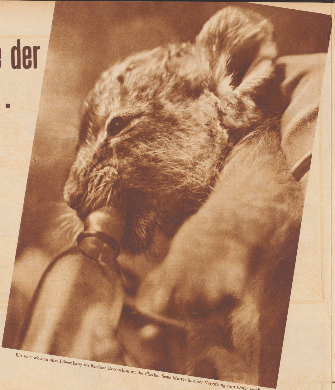
Ein vier Wochen altes Löwenbaby im Berliner Zoo bekommt die Flasche. Seine Mutter ist einer Vergiftung zum Opfer gefallen.