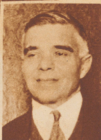
A. A. Trojanowski, der erste sowjetrussische Gesandte in Amerika

Von Amerika kommend, ist der sowjetrussische Volkskommissär Litwinow am 2. Dezember in der italienischen Hauptstadt eingetroffen. In Rom hat sich dann während seinem sieben-tägigen Aufenthalt ein Füllhorn echter bürgerlicher Gastlichkeiten mit Banketten, Empfängen und Ausflügen über ihm entleert. Litwinow besuchte den Nemese, die Meliorationen in den pontinischen Sümpfen und unternahm verschiedene andere Autotouren im alten und neuen Rom. Den Höhepunkt seines Aufenthaltes in Rom aber bildete eine fünfviertel Stunden dauernde Besprechung mit Mussolini. Unser telegraphiertes Bild zeigt die beiden Staatsmänner im Palazzo Venezia.