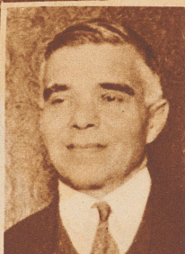
A. A. Trojanowski, der erste sowjetrussische Gesandte in Amerika

Von Amerika kommend, ist der sowjetrussische Volkskommissär Litwinow am 2. Dezember in der italienischen Hauptstadt eingetroffen. In Rom hat sich dann während seinem sieben-tägigen Aufenthalt ein Füllhorn echter bürgerlicher Gastlichkeiten mit Banketten, Empfängen und Ausflügen über ihm entleert. Litwinow besuchte den Nemese, die Meliorationen in den pontinischen Sümpfen und unternahm verschiedene andere Autotouren im alten und neuen Rom. Den Höhepunkt seines Aufenthaltes in Rom aber bildete eine fünfviertel Stunden dauernde Besprechung mit Mussolini. Unser telegraphiertes Bild zeigt die beiden Staatsmänner im Palazzo Venezia.