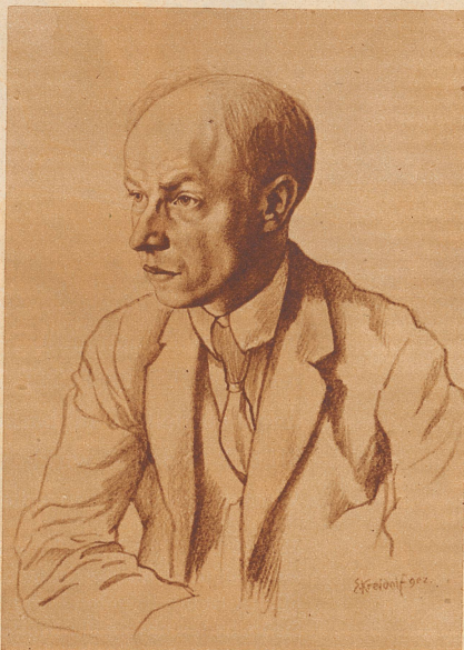
Nach einer Lithographie von Ernst Kreidolf

Potter begann wieder etwas zu brummen, aber plötzlich hob Gilley seine Matrosenpranke und hielt ihm mitten ins Gesicht. Der Amerikaner sackte nur auf seinem Stuhl zurück. Gilley fand den Schlüsselbund, ergriff die beiden Taschen und trat, den Rücken zur Tür und den Blick auf