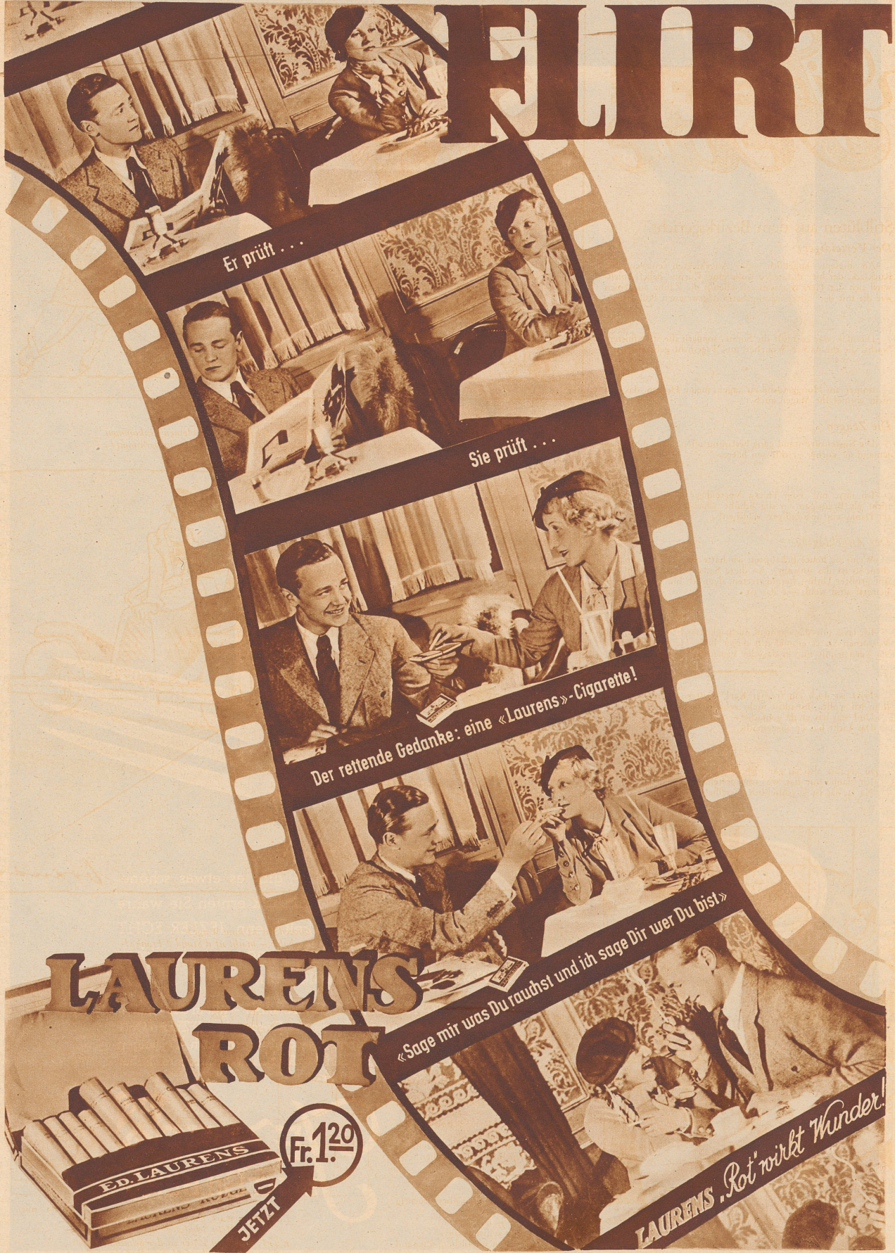
Er prüft ...