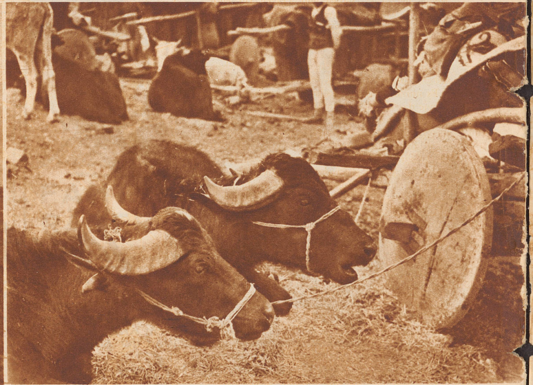
Der genügsame Büffel ist das Zugtier, der Ochsenkarren mit den Vollrädern ist seit Mohammeds Zeiten in Anatolien bis auf den heutigen Tag Transportmittel geblieben. Wegen des ächzenden «Gangs» ihrer Vollräder werden diese Karren «Nachtigallen» genannt.