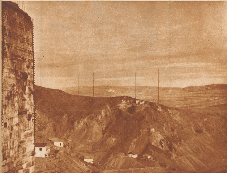
Blick von der uralten Burg von Ankara auf die neue Radiosendestation. Kemal Pascha, in richtiger Erkenntnis der mächtigen Bedeutung, die dem Radio zur Erziehung eines zum großen Teil noch analphabetischen Volkes zu modernen Menschen zukommt, hat nicht unterlassen, in der Nähe der Landeshauptstadt einen sehr leistungsfähigen Sender zu errichten, der das ganze Land mit Nachrichten versorgt.