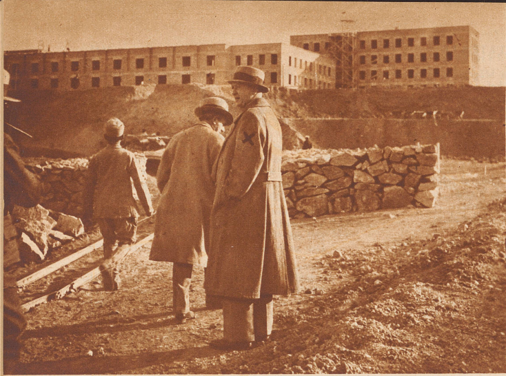
Moderne Türkei. Ein großartiges Regierungsviertel ist in der Hauptstadt Ankara im Entstehen begriffen. Dieses halbfertige Gebäude ist ein Teil davon. Es ist das zukünftige Innenministerium, erbaut nach den Plänen des Wiener Architekten Holzmeister (X), der auch das Nationaldenkmal der türkischen Republik in Ankara geschaffen hat.