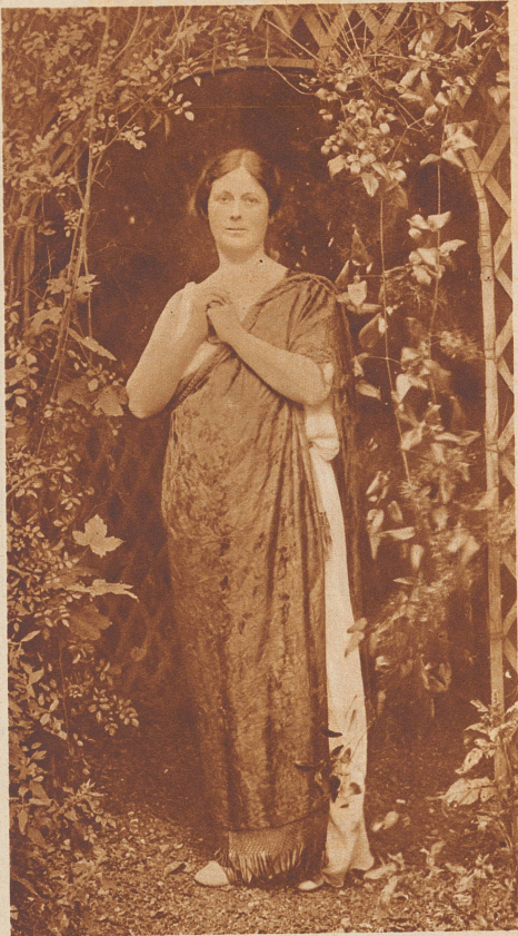
Isadora Duncan. Eine der größten Tänzerinnen der Vorkriegszeit. Sie stammte aus San Franzisko. Nach dem Erdbeben von 1906 verließ sie ihre Heimat, kam nach Europa und feierte bei jedem Auftreten große Triumphe. Seit 1920 lebte sie an der französischen Riviera. Hier ereilte sie unter ganz sonderbaren Umständen der Tod: Die Tänzerin ließ bei einer Autofahrt ihren langen Schal frei im Winde flattern. Das fliegende Ende verfang sich in den Speichen eines Hinterrades, wickelte sich da auf und schnürte der Künstlerin den Hals so unglücklich zusammen, daß sie starb.