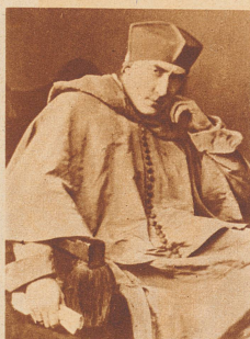
Lawrence Irving , Englands berühmtester Schauspieler, ertrank auf der Rückfahrt von einer amerikanischen Gastspielreise beim Zusammenstoß seines Dampfers «Empress of Ireland» mit dem norwegischen Kohlenkessel «Storstad» im St. Lorenzstrom. Besonders tragisch bei diesem Fall ist folgender Umstand: Irving wollte ursprünglich mit der «Teutonic» seine Heimreise antreten und hatte bereits auf diesem Schiff einen Platz belegt. Im letzten Augenblick änderte er seinen Plan — niemand wußte warum. Er entschloß sich für die «Empress of Ireland», die nun sein Schicksalsschiff wurde.