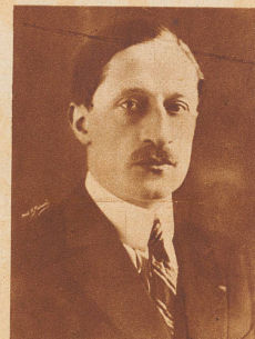
Maurice Bokanowsky , Handels- und Luftfahrtminister von Frankreich, fand den Tod im Jahr 1927 anlässlich einer Luftfahrt bei einem sonntäglichen Flugmeeting. Er war der erste französische Minister, der für seine Reisen regelmäßig das Flugzeug benutzte.