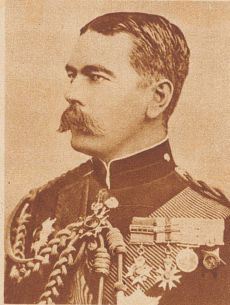
Lord Kitchener , der Eroberer des Sudans und Oberkommandierender der englischen Truppen im Burenkrieg, starb im Weltkrieg auf dem Kriegsschiff «Hampshire», das auf der Reise von England nach Archangelsk durch eine Mine in die Luft gesprengt wurde. Kitchener, der große Strategie, wollte sich nach Rußland begeben, um die dortige Kriegführung zu reorganisieren.