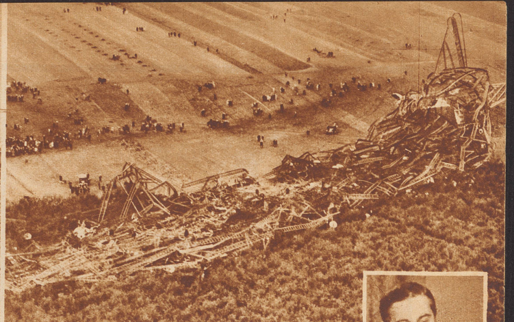
Die größte Luftschiffkatastrophe der Geschichte. Auf der Fahrt von England nach Indien stürzte in der Nacht vom 4. zum 5. Oktober 1930 bei Bauvais in Nordfrankreich das englische Luftschiff «R 101» ab und verbrannte. 38 Mann der Besatzung und 13 Passagiere kamen ums Leben. Unter den letzteren der englische Luftfahrtminister Lord Thomson. Die Ueberreste des «R 101» am Morgen nach der Katastrophe. — Rechts: Lord Christofer B. Thomson.