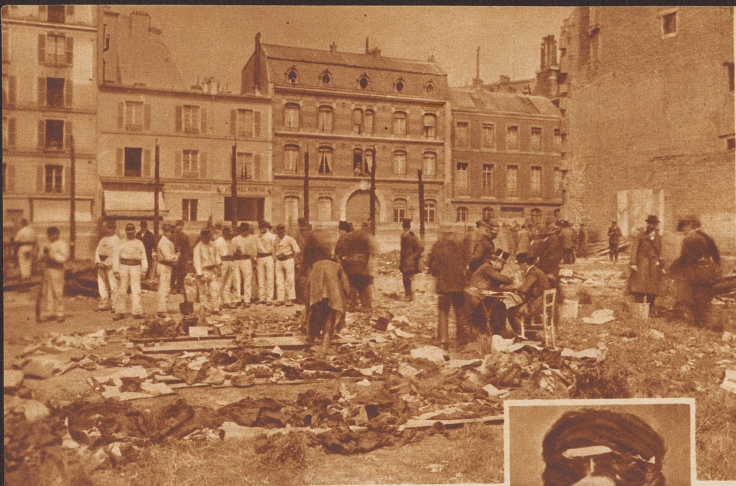
Der Brand des Wohltätigkeitsbasars in der Pariser Rue Jean Goujon. Am 4. Mai 1897 ereignete sich in der französischen Hauptstadt eine Feuersbrunst von ganz ungewöhnlichen Ausmaßen und Folgen. Infolge Explosion einer Projektionslampe geriet der Basar, den die verschiedenen Wohltätigkeitsvereine jedes Jahr veranstalteten, in Brand. Die Katastrophe forderte 124 Todesopfer, unter ihnen die Herzogin von Alençon. Ihre Leiche konnte nach dem Brande nicht aufgefunden werden. Nur ihren Trauring mit der Inschrift «Duchesse d'Alençon, Princesse de Bavière», fand man in einer Ecke der völlig verkohlten Halle. Unser Bild zeigt die Polizeibeamten bei der Durchsuchung der Brandstätte nach Gegenständen, die zur Identifizierung der Opfer nützlich sein könnten. Rechts: Die Herzogin von Alençon , geborne Prinzessin Sophie von Bayern. Sie war die Schwester der Kaiserin Elisabeth von Oesterreich, die in Genf vom Anarchisten Lucheni ermordet wurde.