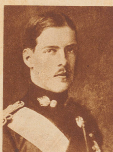
Alexander I. , König von Griechenland. Als 1917 König Konstantin, der Schwager Wilhelms II., auf Drängen der Entente die Regierung niederlegen mußte, folgte ihm sein zweiter Sohn als Alexander I. auf den Thron. Die Herrschaft des jungen Königs dauerte nicht lange. Eines Tages wurde er bei einem Spaziergang im Park seines Schlosses von einem Affen gebissen. An den Folgen dieses Bisses starb er kurze Zeit nachher. Die öffentliche Meinung hat die Erklärung dieser Todesursache immer mit Mißtrauen aufgenommen. In der Tat gehört diese Königstragödie nicht nur in die Reihe der zufälligen, sondern ebenso der mysteriösen Todesfälle.