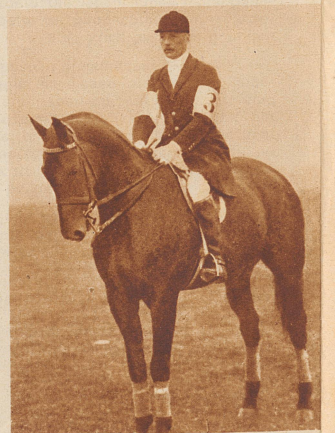
Prinz Sigmund von Preußen verunglückte tödlich durch einen Sturz vom Pferd beim Internationalen Concours Hippique in Luzern im Jahre 1929.

Es liegt immer eine eigenartige Tragik darin, wenn bei einem Unglück, das durch Naturereignisse oder durch andere Umstände hervorgerufen wird, eine Persönlichkeit den Tod findet, die im Vordergrund des öffentlichen Interesses steht. Allerdings, die Zahl großer Männer, die im Laufe der Geschichte durch unglückliche Zufälle ums Leben gekommen sind, erscheint nicht sehr groß. Sie kann auch gar nicht groß sein, denn bedeutende Köpfe sind niemals zahlreich gesät gewesen. Aber jedesmal, wenn so ein Großer mit unter den Opfern irgendeiner Schiffs- oder Eisenbahnkatastrophe zu finden ist oder sonst unter außerordentlichen Umständen einen rapiden Tod gefunden hat, dann ist es, als züde das Weltgewissen für einen Augenblick schmerzlich zusammen, dann ist es, als würde es sich selbst darüber, daß einer, dem vielleicht noch mancherlei zum Wohle der Menschheit zu tun übriggeblieben wäre, so unbarbarisch herabberufen wurde.