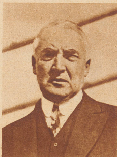
Warren G. Harding , der Nachfolger Wilsons in der Präsidentschaft Nordamerikas, starb auf einer Reise nach Alaska im August 1922 an den Folgen einer Fischvergiftung. Das war die offizielle Meldung, die durch die Presse ging. Später sind um diesen Todesfall eine Unmenge Gerüchte in Umlauf gebracht worden. In einem Buche, das in U.S.A. eine ungeheure Auflage erlebte, wurde sogar behauptet, seine Gattin hätte ihn vergiftet, um seine Ehre zu retten. Denn in der Tat war zu jener Zeit ein Riesenkorruptionsskandal am Ausbrechen, in welcher Affäre Harding arg kompromittiert wurde.