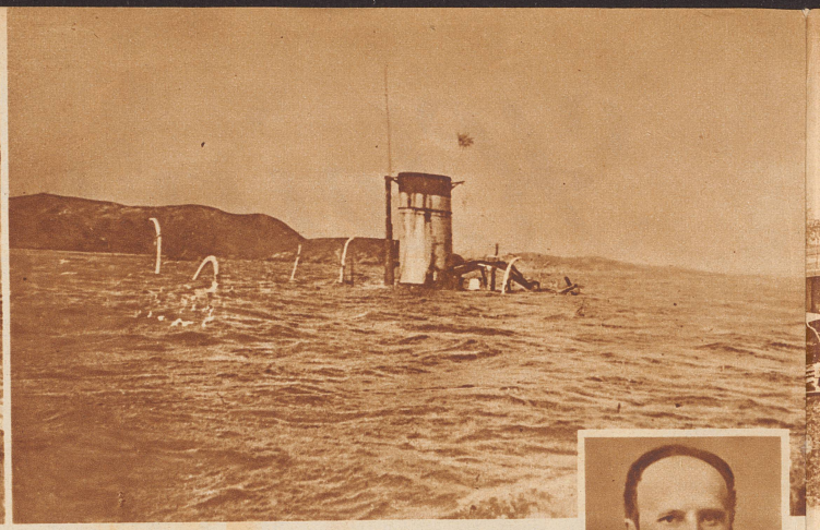
Das russische Flaggschiff «Petropawlowsk» auf dem Meeresgrund vor Port Arthur. Dieser Panzerkreuzer wurde am 13. April 1904 im russisch-japanischen Krieg von den Japanern in den Grund gebohrt. An Bord des Schiffes befand sich der berühmte russische Schlachtenmaler Wassilij Wereschtschagin. Er ertrank. — Rechts: Wassilij Wereschtschagin .