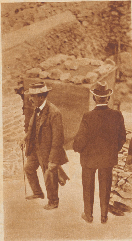
Lord Carnarvon. Der große englische Aegyptologe und Entdecker des Tutankhamon-Grabes wurde bei seinen Ausgrabungsarbeiten das Opfer eines giftigen Insektenstiches.

Es liegt immer eine eigenartige Tragik darin, wenn bei einem Unglück, das durch Naturereignisse oder durch andere Umstände hervorgerufen wird, eine Persönlichkeit den Tod findet, die im Vordergrund des öffentlichen Interesses steht. Allerdings, die Zahl großer Männer, die im Laufe der Geschichte durch unglückliche Zufälle ums Leben gekommen sind, erscheint nicht sehr groß. Sie kann auch gar nicht groß sein, denn bedeutende Köpfe sind niemals zahlreich gesät gewesen. Aber jedesmal, wenn so ein Großer mit unter den Opfern irgendeiner Schiffs- oder Eisenbahnkatastrophe zu finden ist oder sonst unter außerordentlichen Umständen einen rapiden Tod gefunden hat, dann ist es, als züde das Weltgewissen für einen Augenblick schmerzlich zusammen, dann ist es, als würde es sich selbst darüber, daß einer, dem vielleicht noch mancherlei zum Wohle der Menschheit zu tun übriggeblieben wäre, so unbarbarisch herabberufen wurde.