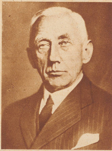
Roald Amundsen , der Entdecker des Südpols und große Arktisforscher, fand den Tod beim Absturz des Flugzeuges «Latham», mit dem er und der französische Flieger Guilhaume eine Suchexpedition nach dem verschollenen italienischen Flieger Nobile in den Weg geleitet hatte.