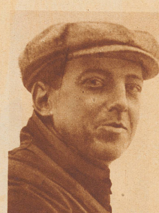
Hubert Latham , einer der ersten französischen Flieger, der in den Jahren 1908/1910 große Triumphe erlebte, starb ausnahmsweise nicht bei einem Flugunfall, wie unzählige seiner Kameraden, sondern im französischen Kongo, wo er seiner Passion, der Jagd auf Großwild, oblag, wurde er von einem Büffel aufgespießt.