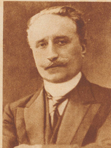
Paul Deschanel , Präsident von Frankreich, stürzte aus einem fahrenden Schnellzug. Bis heute sind die näheren Begleitumstände dieses Unfalls nicht restlos geklärt. Jedenfalls ist Deschanel nach der verhängnisvollen Nacht schwer geschädigt ins Elysée zurückgekehrt und starb bald an den Folgen des geheimnisvollen Eisenbahnunfalls.