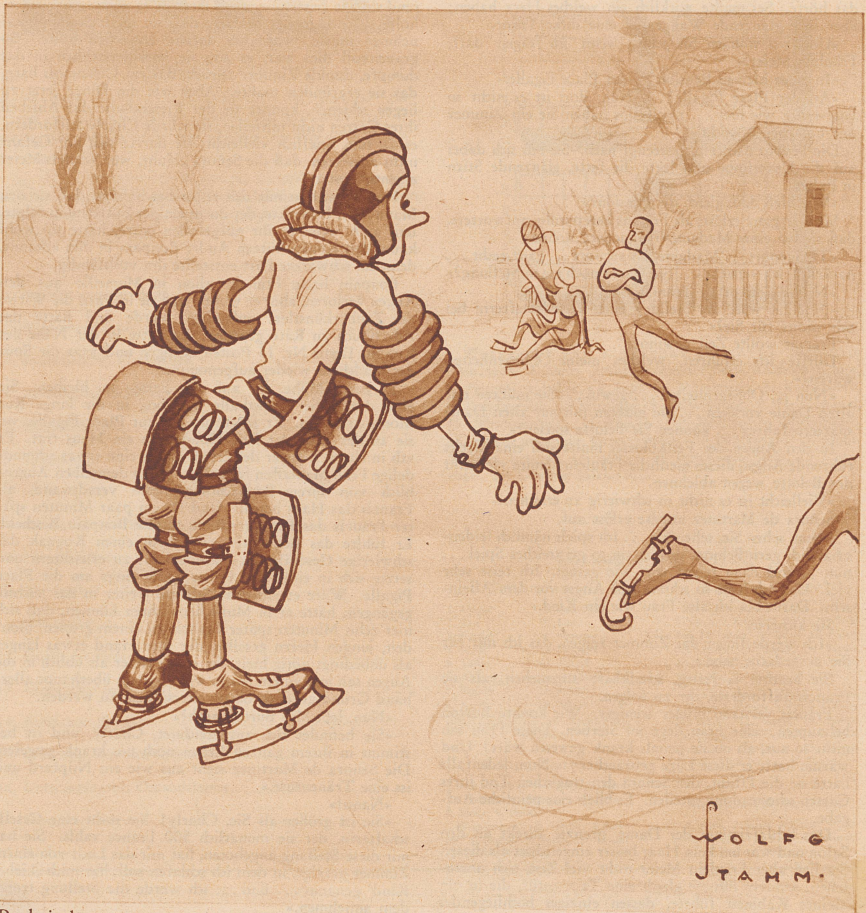
Praktischer Anzug für ängstliche Anfänger auf der Eisbahn.

Graphologie. «Zwei ganz verschiedene Schriftarten derselben jungen Dame. Die beiden Briefe können höchstens innerhalb dreier Wochen geschrieben sein. Aber deutlich sieht man, daß die Dame beim ersten Brief ihren Blinddarm noch hatte, beim zweiten nicht mehr.»