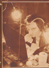
In der Garderobe: Teilung, der Umkleierin in schon fertig, ist hungrig und schmeckt sich ab.