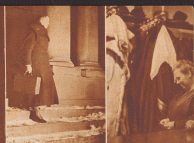
Das ist der Paga der Elia und Lohengrin in Bezugnahme gefahren hat. Sein Tagewort ist fertig. Die fünf Minuten nach elf verläßt er zu seiner Elia Elia die Theater.