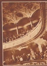
Die Zehnwart, hageböhne, mahliges, teilschrotes, kalte, bogenlos, im wackeligen und weniger musikalische, ein ständiger-wider, zusammen die Publikum genannt.