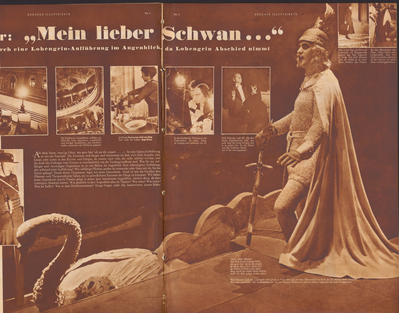
Fünf Minuten nach elf. Lohengrin wird gleich zu Ende sein und aus dem Silberreiter im Kleid des 20. Jahrhunderts abblitzen. Elia sinkt zusammen. Die Zuschauersitze, die am längsten Widerstand geleistet haben, beginnen nun auch zu klappen.

„Mein lieber Schwan! Ach diese letzte traurige Fahrt, wie gern hätte ich sie dir erspart, in diesem Jahr, wenn dein Ziel im Dienst zu Ende sein sollte, dann durch der Ordn' Mach' befohle, wollt' ich dich, anders wieder seh'n.“