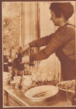
In dieser Restaurant wird um diese Zeit noch das Letzte abgeräumt.