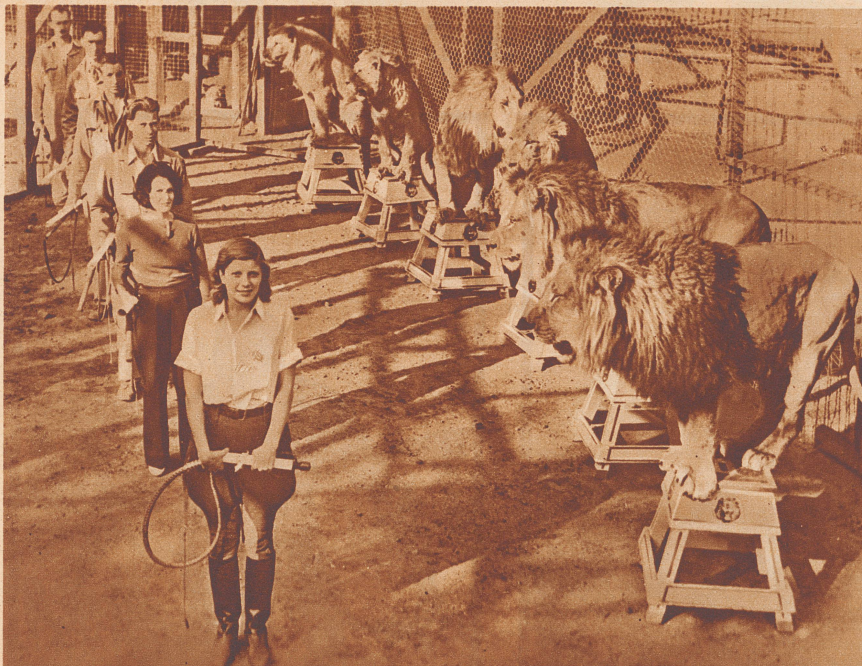
Examen im «Klassenzimmer» für Löwenbändiger.