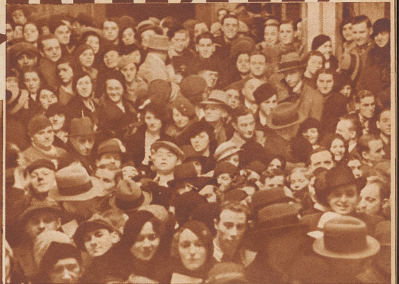
Die Wartenden. Im Vorraum des Orient-Kino drängen sie sich und rücken langsam vor, immer näher zu ihr, deren Abbild sie so oft auf der Leinwand sahen und vor deren leibhaftiger Gestalt sie nun in zehn, fünf oder gar schon in zwei Minuten stehen werden. Für zwanzig Rappen haben sie sich eine Karte gekauft. Brigitte wird sie in der Hand halten und ihre Unterschrift darauf setzen und unbezahlbar ist plötzlich das zwanziggräpige Stück Papier geworden, womit sein Besitzer die Erinnerung an ein Lächeln, an einen Augenaufschlag, an eine schöne Nackenlinie und an ein kleineres oder größeres Herzklopfen mit nach Hause nimmt.

Druck und Verlag: Conzett & Huber, Zürich und Genf