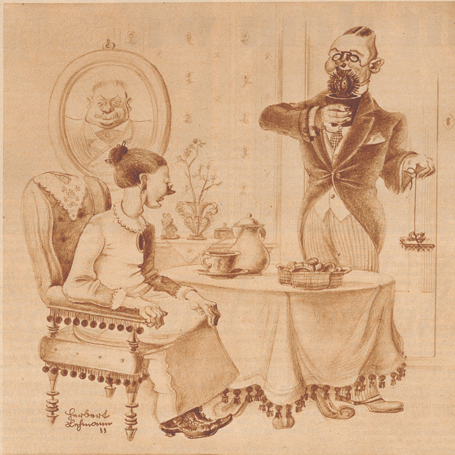
Die kurzsichtige Tante.

«Und was kriege ich, wenn ich die ganze Perücke bringe?»