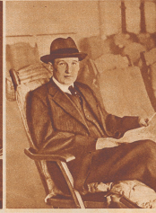
Lesage Verbrecher aus Varnhagenstraße