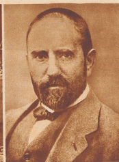
Stinnes das Genie ohne Privatleben