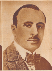
Hatry Bewürzer der englischen Tradition