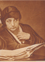
Kreuger Das Ritzel des Dautin