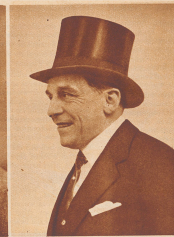
Löwenstein der „Milliarde“ — in sich