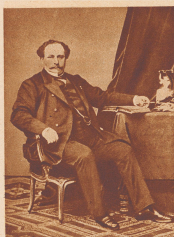
Strouberg der Napoleon der Industrie