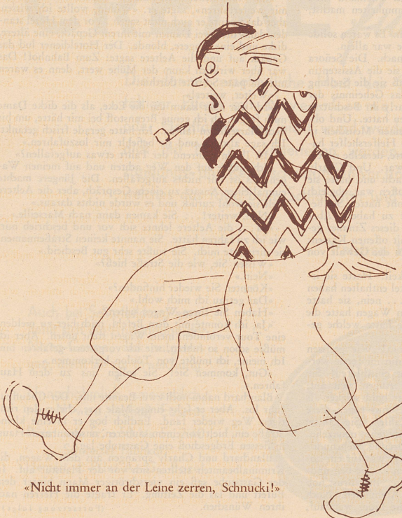
«Nicht immer an der Leine zerran, Schnucki!»

«In welcher Flüssigkeit löst sich Silber am schnellsten auf?» «Im Alkohol!»