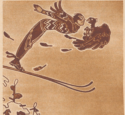
Schreckliches Abenteuer eines Sprungrekordmannes im Gebirge.

Astronomie. Zwei Freunde diskutieren spät abends auf dem Heimweg vom neuen Wein über den Mond. «Auf dem Mond muß es ja schrecklich sein. Keine Bäume, kein Wasser, keine Menschen, überhaupt nichts. Ich möchte nur wissen, wozu der eigentlich da ist.» «Das sag ich auch. Aber wo soll er hin?»