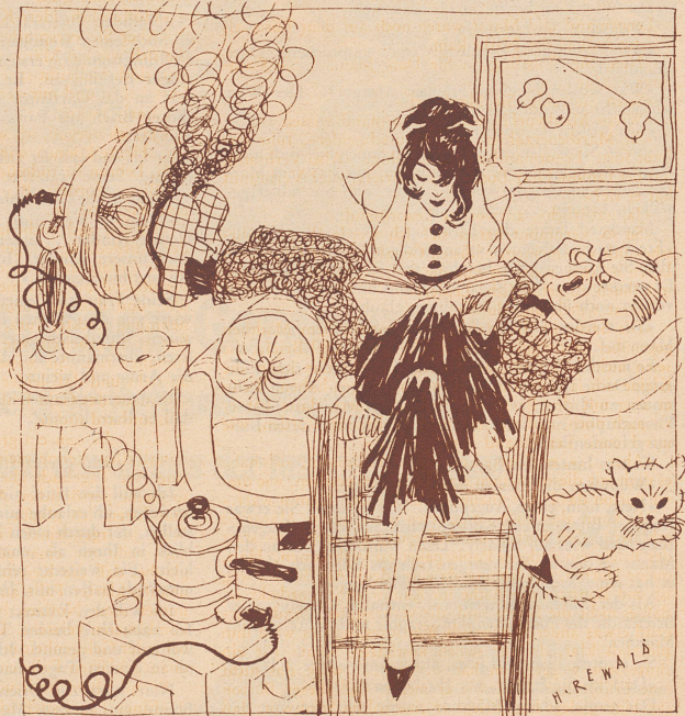
«Paß doch auf, Päuly, du läßt ja schon wieder das Essen anbrennen —!»

«Ich las kürzlich in der Zeitung, daß man in einem alten ägyptischen Tempel Drähte gefunden hat, die zu beweisen scheinen, daß die alten Ägypter schon eine Art Telefon hatten.» «Das ist ja möglich, aber die alten Assyrer waren doch schon viel weiter! Bei Ausgrabungen in Babylon hat man keine Drähte gefunden, und das ist doch der sicherste Beweis dafür, daß man dort schon drahtlos miteinander verkehrte.»