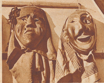
Der alte Larvenschnitzer aus Flums ist ein wahrer Künstler, der alle möglichen Gesichter und Fratzen schnitzen kann.