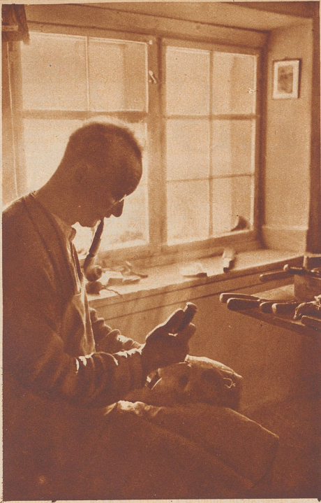
In Flums im Sarganserland ist es Sitte, an der Fastnacht hölzerne Larven zu tragen. Ein alter Mann schnitzt sie in seiner Werkstatt aus Eschen- oder Lindenholz.