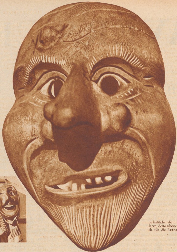
Je häßlicher die Holzlarve, desto schöner ist sie für die Fastnacht.