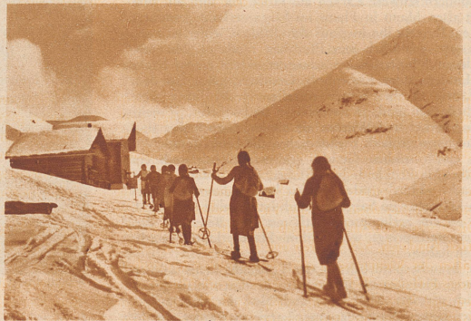
Die Schule ist aus! Auf Skiern wird im Winter der oft kilometerweite Weg nach Hause zurückgelegt. Zur Sommerzeit ist die Schule geschlossen.