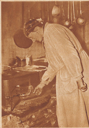
Das ganze Averstal ist so waldarm, daß das Brennholz für den täglichen Gebrauch zum großen Teil aus der Niederung heraufgeschafft werden muß. Da behilft man sich nun so: der Schafmist aus den Ställen wird getrocknet, zwei Jahre lang gelagert und dient dann, «brennreif» geworden, als Brennmaterial.