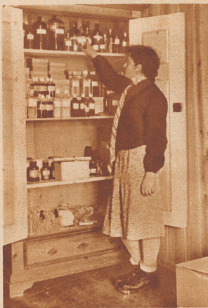
Die Gemeindeapotheke von Cresta. Der nächste Arzt wohnt 32 km weit entfernt, in Splügen. Er kommt nur in dringenden Notfällen herauf nach Cresta. Die Krankenkasse hat für die erste Hilfe bei Erkrankungen und Unfällen ein Medikamentendepot im Pfarrhaus eingerichtet, das von der Frau Pfarrer verwaltet wird.