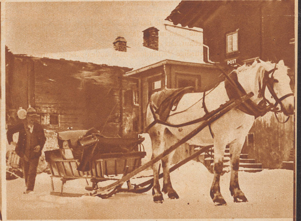
Eine Einspänner-Schlittenpost vermittelt den Bewohnern von Cresta die Verbindung der Außenwelt. Alles, was diese Menschen zum Leben nötig haben, wird mit diesem Schlitten in täglich fünfständiger Fahrt vom Tal heraufgefahren. Eine Bäckerei beispielsweise gibt es in Cresta nicht. Der Brotbedarf des Tales wird von auswärts gedeckt, die Postverwaltung übernimmt den Transport zu Spezialtarifen.

anderswo die Bauern noch auf Wochen hinaus mit dem Einbringen der Früchte ihres Bodens beschäftigt sind. Hier oben aber gibt es nichts zu ernten, keine Obstbäume, kein Getreide, keine Kartoffeln, nur ein bißchen Gemüse und Salat vermag der karge Boden in den kurzen Sommermonaten herzugeben. Dementsprechend ist das Leben hier oben ganz auf Viehwirtschaft eingestellt. Die letzte Viehzählung ergab einen Bestand von 593 Stück Rindvieh, 529 Schafen und 693 Ziegen. Das starke Fallen der Viehpreise in den letzten Jahren hat auch in dieses entlegene Tal seine schweren wirtschaftlichen Folgen und Sorgen gebracht, denn der Erlös aus seinem Vieh ist die einzige Einnahmequelle des Averser Bergbauern.