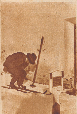
Der Seelsorger von Cresta. Auch er legt seine Dienstgänge in der ausgedehnten Pfarrei größtenteils auf Skiern zurück.

Rund sieben Monate im Jahr liegt das Dörfchen unter einer Schneedecke. Der erste bleibende Schnee fällt zuweilen schon Ende-September, also zu einer Zeit, da