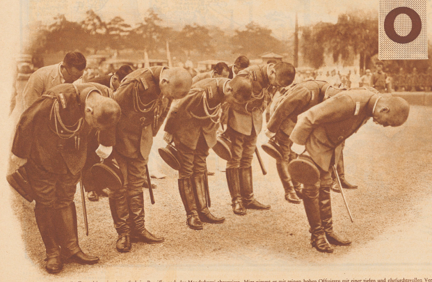
Ein General ist mit seinem Stab im Begriffe, nach der Mandchurien abzuziehen. Hier nimmt er mit seinen hohen Offizieren eine ruhige und charakteristische Verabschiedung...