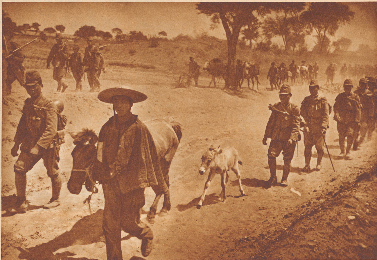
Ausschnitt aus dem japanischen Vormarsch in Nordchina im Jahr 1932