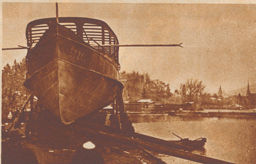
Das Schiff gleitet auf den zwei schiefen Balken, die mit Schmierseife eingefettet sind, seitwärts ins Wasser.

alles genau erklären: wie die Arbeiter und Techniker die dicken Balken unter das Schiff schoben und deren Gleitflächen mit Schmierseife einrieben. Wie sie den Schiffskörper vorsichtig gegen die Landseite zu neigten und auf der andern Seite des Rumpfes mit Keilen blockierten, damit das Schiff nicht mit dem Deck vornüber ins Wasser plumpste. Wie dann auf das Kommando: Los! zwei Männer mit einem Axthieb die dicken Seile, an denen das Schiff noch befestigt war, durchhieben. Wie das Schiff, eins, zwei, drei, die Balken hinunterrutschte und ins Wasser sauste, daß die Wellen hoch aufspritzten. Darauf fuhr eine Dampfschwalbe den «Etsel», so heißt das neue Schiff, über den See in die Werft. Dort kommt noch der Schiffsmotor hinein, Dach und Deck werden gebaut, bis die Schwalbe fix und fertig dasteht und im Monat Mai eingeweiht werden kann.