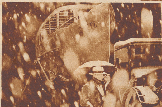
Bei heftigem Schneegestöber fährt «Etsel», das neue Schiff, zu nächstlicher Stunde durch die Straßen von Zürich.