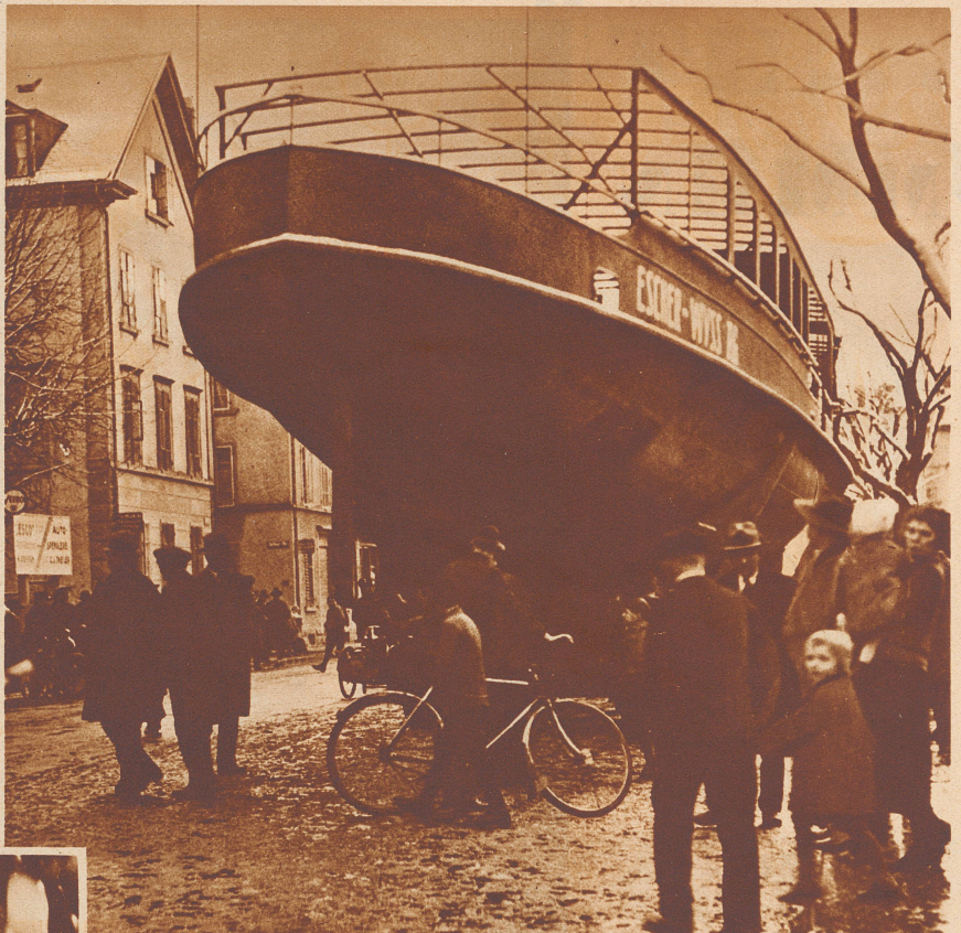
Das Schiff ist mitten in der Stadt stecken geblieben. Da es sonst in gefährliche Nähe der elektrischen Tramleitungen käme, muß der Transport auf die Nacht verschoben werden, wenn keine Tramwagen mehr fahren.