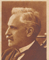
Bundesrichter Dr. V. Merz

Die Schweizerische Luftverkehrs-Gesellschaft hat in Amerika ein neues Express-Großverkehrsflugzeug erworben, das in diesen Tagen aus Cherbourg in Dübendorf eingetroffen ist und am 1. Mai auf der Linie Zürich-Wien in Dienst gestellt wird. Die Maschine, die das allmodernste Verkehrs-Luftfahrzeug darstellt, bietet Platz für zehn Passagiere und zwei Piloten, besitzt einziehbares Fahrgestell und wird angetrieben von einem 720 PS-Wright-Cyclone-Motor, der eine maximale Geschwindigkeit von 320 und eine durchschnittliche Reisegeschwindigkeit von 260 Kilometer gestattet. Die Reise von Paris nach Dübendorf wurde in knapp zwei Stunden zurückgelegt.