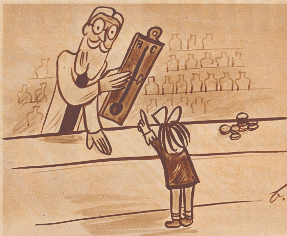
Eine Kleine kommt in die Apotheke und verlangt ein Thermometer. «Willst du ein kleines oder ein großes?» fragt der Apotheker. «Geben Sie mir ein recht großes», sagt die Kleine, «damit wir eine schöne warme Stube bekommen.»