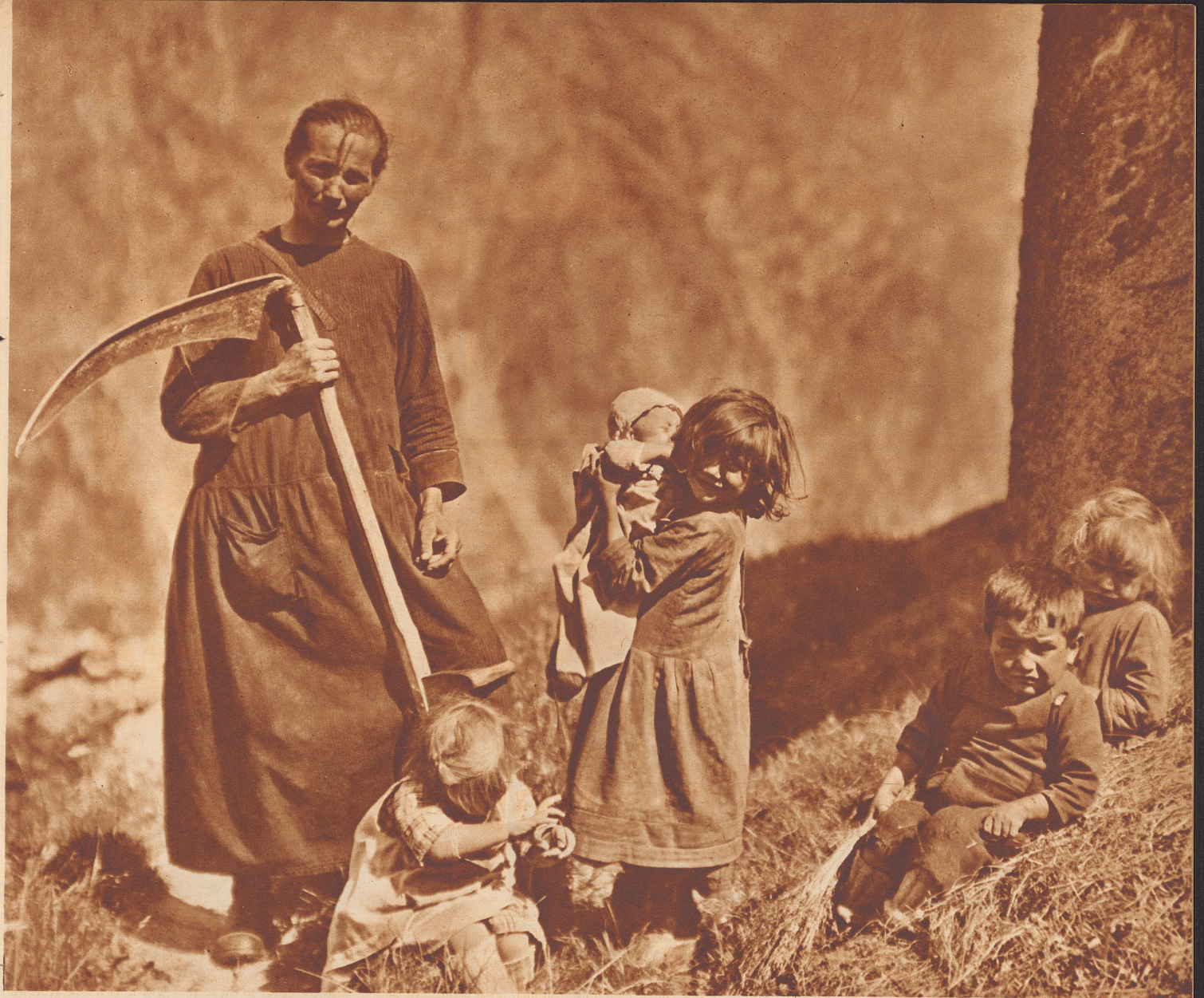
Wenn der Walliser Bergbauer im Tale Arbeit und Verdienst sucht, dann lastet die ganze Arbeit zu Hause auf der Frau. Arbeit im Hause, im Stall und auf dem Feld. Die Kinder müssen alle mit. Sie sitzen am Wegrand und spielen mit Steinen; kein buntbemaltes, blechernes Spielzeug billiger Machart und mit großem Reklamelärm auf den Markt geworfen, kommt in ihre Hände. Die Blumen am Weg entzünden die kindlichen Phantasien, aus Holzstücken entstehen die erstaunlichsten Gebilde. Das lebendige Wasser rauscht an ihnen vorüber. Die Mutter hat wenig Zeit, und das kleine Mädchen, das noch kaum zur Schule geht, hat schon seine Pflicht und Aufgabe, den Säugling zu warten. Noch kein erwachsener Mensch, noch nicht zum Leben richtig erwacht und schon ein wenig Mutter.