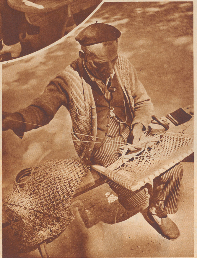
Ihm ist die Zeit bis zur Heilung lang geworden. Er will seine Tage nicht müßig verbringen und hat sich eine nützliche Arbeit zugelegt.