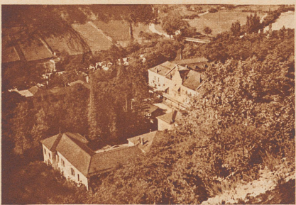
Die Kuranstalten von Lavey-les-Bains.