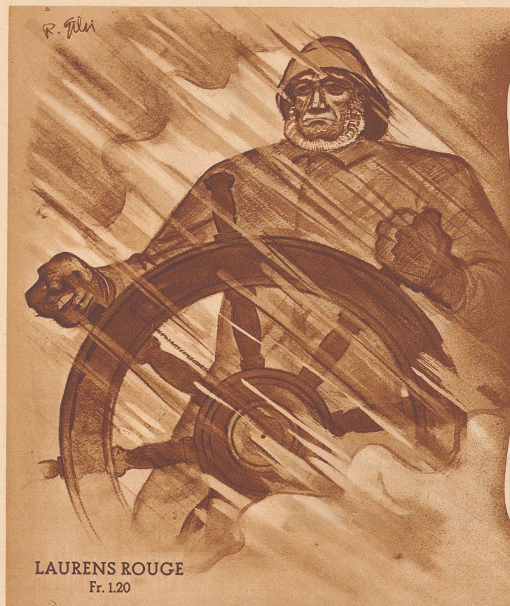
LAURENS ROUGE Fr. 1.20

Erfahrung - kann man niemals kaufen! denn sie ist stets das Produkt aus jahrelangem heissen Ringen nach Vollkommenheit, aus Wissen, das nur die Erprobung schaffen kann!... Ein alter Name ist infolgedessen stets der Bürge für Erfahrung, denn durch sie - hat er ja erst Gewicht erlangt! Sinnfällig zeigt darum der Name einer Zigarette schon, welch' Hochgenuss sie bieten muss: