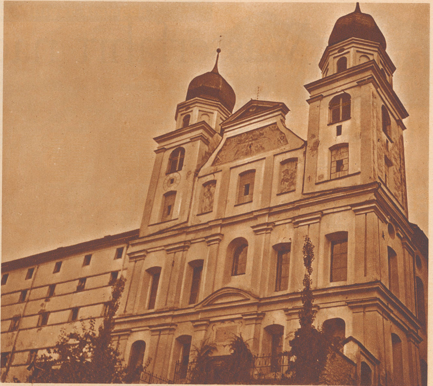
Bad Disentis besitzt neben seinem gesunden Klima eine stark radiumhaltige Quelle. Bekanntlich liegt Disentis an der Weggabel Lukmanier-Oberalp und ist nicht nur berühmt durch seine landschaftlichen Schönheiten, sondern auch durch sein Kloster, dessen Gründung als Pfalzklöster ins 7. Jahrhundert zurückreicht. Die Disentiser-Quelle wird für Rheumatismus, Gicht, Krankheiten der Niere, Blase, des Magens und Herzens empfohlen. Auch für Nervenleidende besitzt eine Disentiser Wasserkur in Verbindung mit der guten Luft und der Ruhe eine sehr wohltätige Einwirkung.

Sie war in Paris, im Jahre 1899, noch als dreißigjährige Frau auf dem Theater des M. Comte zu sehen.