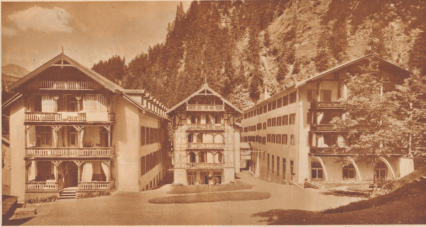
Bad Fideris im Prätigau liegt eine halbe Stunde vom gleichnamigen Dorfe entfernt in einem waldigen Talkessel. Das Wasser seiner kräftigen Sauerquellen wird bei Magen-, Darm- und Herzbeschwerden sowie bei Nervosität und Ueberanstrengung recht erfolgreich getrunken und als Bäder gebraucht.