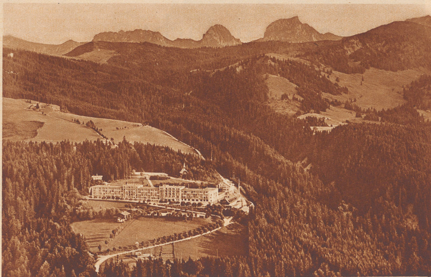
Gurnigel , das schöngelagerte Bad im Berner Oberland ist nicht allein seiner starken Schwefelquelle und seiner schönen Lage wegen berühmt; auch die römischen Münzfunde, die man in der Nähe des Bades machte, haben schon viele Fremde in die einzig schöne Landschaft gelockt. Die Heilquellen von Gurnigel haben sich in der Anwendung gegen Magen- und Darmkrankheiten, bei Nasen- und Kehlkopfleiden und bei Stoffwechselkrankheiten aller Art bestens bewährt.