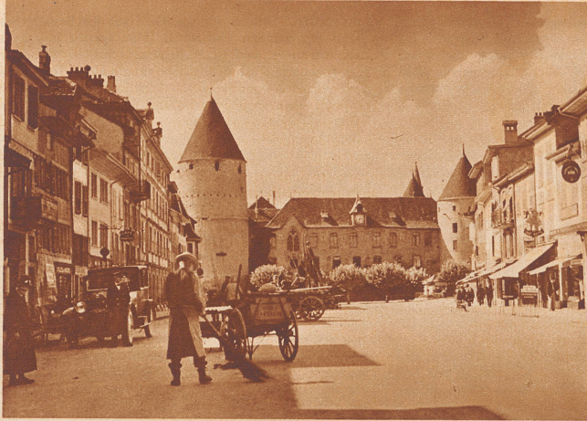
Der Marktplatz in Yverdon.