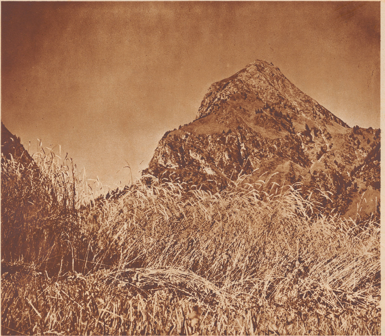
Aquarossa , das einzige Bad in der Südschweiz, ist von der Station Biasca aus oder mit dem Postauto über den Lukmanier zu erreichen. Das Dorf Aquarossa mit 37 Einwohnern ist von hohen Bergen umsäumt und liegt in der Nähe ausgedehnter Nadelwälder. Eine arsenhaltige Quelle wird zu Trink- und Badekuren gegen Gelenkrheumatismus, Gicht-, Blut- und Hautkrankheiten angewandt. Der Schlamm, den die Quelle absetzt, wird zu Packungen gegen Ischias gebraucht.