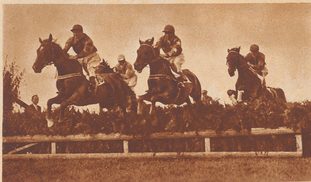
Internationale Pferderennen in Zürich. Die Sensation des zweiten Renntages; der große Preis von Zürich. Das Fünferfeld im Preis von Zürich kurz nach dem Start. An der Spitze Leutnant Musy auf «Nabucho». Sieger in dem Rennen wurde «Ne bögs» vom Stalle Buchmann, Zürich.