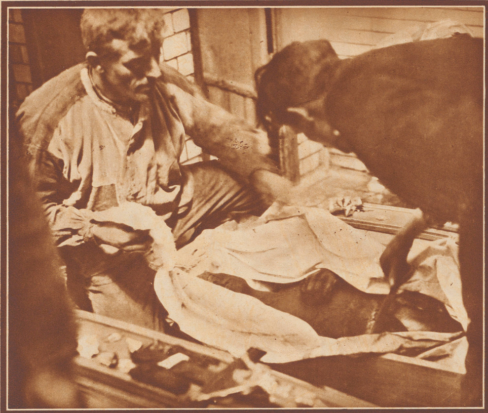
Die Bergwerkskatastrophe von Mons. Am 15. Mai ereignete sich im Kohlenbergwerk Fief de Lambrechies eine Schlagwetterexplosion, die 42 Grubenarbeitern das Leben kostete. Drei Tage später erfolgte im selben Schacht eine zweite Explosion, die weitere 14 Todesopfer forderte. Wegen des ausgebrochenen Brandes waren die Rettungsarbeiten sehr erschwert. Bild: Die verkohlte Leiche eines Bergmanns wird nach der Bergung in einen Sarg gelegt.