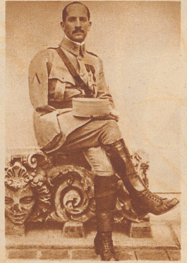
† Maxim Gorkis Sohn der unter dem eigentlichen Familiennamen Peschkoff während des Krieges als Freiwilliger auf Seiten Frankreichs kämpfte, ist in Moskau gestorben. Das Bild stammt aus der Zeit, da ihm als Folge einer Kriegsverletzung der rechte Arm amputiert wurde.

«Bartsch von Sigsfeld» verunglückt. Der größte deutsche Freiballon, der am 13. Mai in Bitterfeld zu einem Höhenflug startete, ist bei dem Dorfe Sebesch an der russisch-litauischen Grenze abgestürzt. Die beiden Insassen, der Führer Dr. Schrenk und der Meteorologe V. Masuch, sind tot. Aus ihren Aufzeichnungen geht hervor, daß der Ballon eine Höhe von 10 000 Meter erreichte. Es scheint, daß die Flieger nicht beim Absturz, sondern schon während des Fluges infolge Versagens der Sauerstoffversorgung den Tod fanden. Bild: Der 9000 m 3 fassende Ballon beim Start in Bitterfeld.