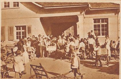
So viele maikäfersammelnde Leute hatten sich an der Abgabestelle eingefunden, daß es Abend und Nacht wurde, bis alle abgefertigt waren und ihren wohlverdienten Lohn erhielten.

«Ach, Vater», meint Ilse, «sag doch lieber Henne.»